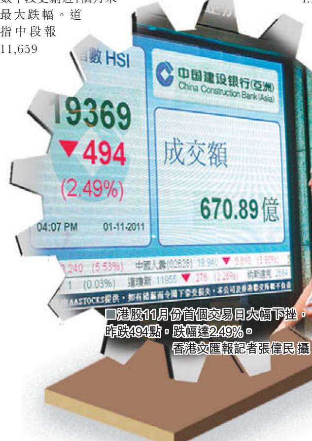
港股11月份首個交易日大幅下挫，昨跌494點，跌幅達2.49%。

香港文匯報訊(記者 卓建安)在10月份港股剛剛出現轉機、市場信心正逐步恢復之際，環球金融市場波瀾再起，美國衍生金融產品交易商明富環球申請破產，以及希臘總理帕潘德里歐稱希臘將就歐盟達成的救援希臘一攬子協議舉行全民公投，市場對歐債危機的擔憂再次升溫。昨日港股踏入11月份首個交易日又大幅下挫，收市報19,369點，跌494點，跌幅達2.49%。