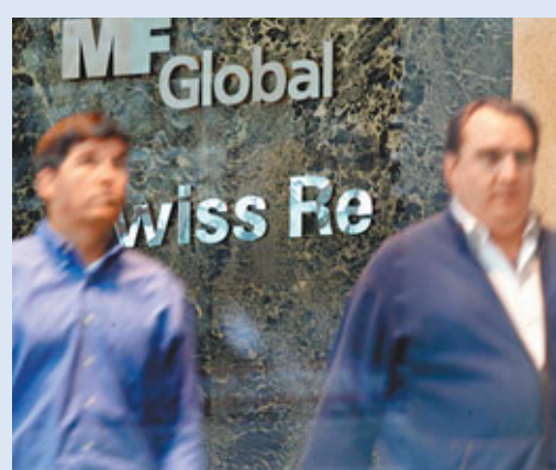
明富環球申請破產保護，其各地的業務陸續受到影響。

港交所通告又指出，明富環球香港獲准為其於香港交易所中央結算系統的證券交易交收；亦獲准依照其客戶的指示並得到其客戶的同意，替其客戶將未平倉期貨及期權合約有秩序地平倉，或將有關倉盤轉移，而有關倉盤的平