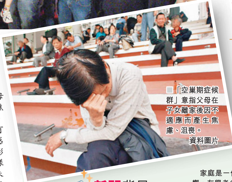
■「空巢期症候群」意指父母在子女離家後因不適應而產生焦慮、沮喪。資料圖片