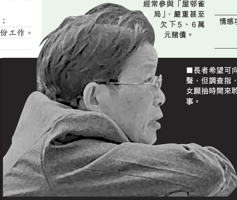
■長者希望可向子女傾吐心聲，但調查指，只有兩成子女願抽時間來聆聽父母的心事。資料圖片

1. 在思考的時候，應先分析資料，包括家庭人數、生育率、生活素質、情感功能的失效。 2. 資料中提及「快樂指數」，此指數與家庭成員間溝通、傾談、傾聽、支持、關懷、尊重、接納、原諒、無條件付出等有關。 3. 首先，先按資料一及二指出現時家庭以核心家庭為主，家庭成員下降，進一步引伸至家庭成員間溝通、傾談、傾聽、支持、關懷、尊重、接納、原諒、無條件付出等有關。