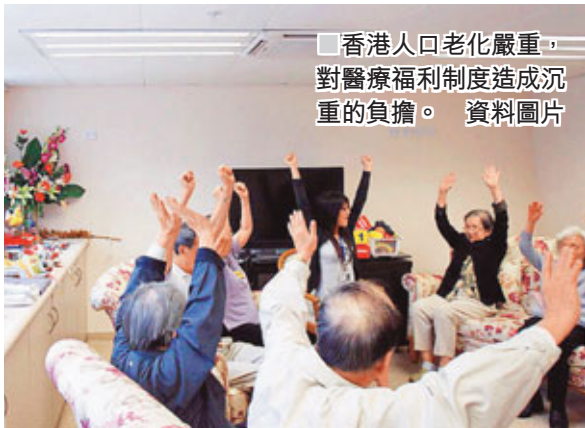
■香港人口老化嚴重，對醫療福利制度造成沉重的負擔。資料圖片

據統計，香港人口持續老化，65歲以上香港人將由2009年的13%增至2039年的28%。人口膨脹的原因有二：一是不斷有內地父母在港所生的子女返鄉後再來港定居，二是香港人越來越長命。2009年，男性的平均預期壽命為79.8年，女性為86.1年，位居全球第二。而香港人的年齡中位數亦由2009年的40.7歲上升至2039年的47.6歲。有人口專家預期香港的人口將持續老化。