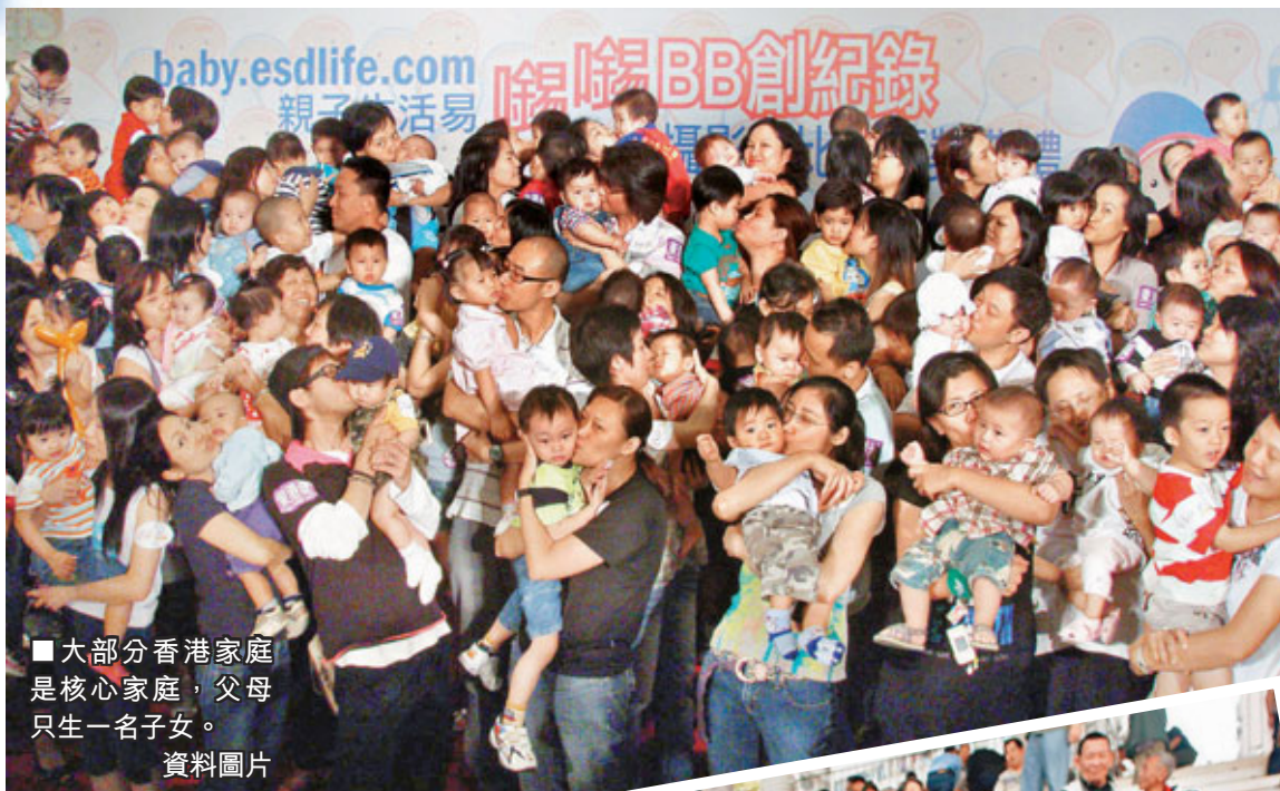
■大部分香港家庭是核心家庭，父母只生一名子女。