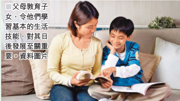
■父母教育子女，令他們學習基本的生活技能，對其日後發展至關重要。資料圖片