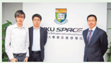
港大SPACE加開2年制航空學高級文憑學額，由目前42個大幅增至73個，每年學費為49,800元。

香港文匯報訊(記者 劉思諾)香港機場將開設第三條跑道，航空業專才需求同時大增。香港大學專業進修學院決定加開2年制航空學高級文憑學額，由目前42個大幅增至73個，每年學費為49,800元。