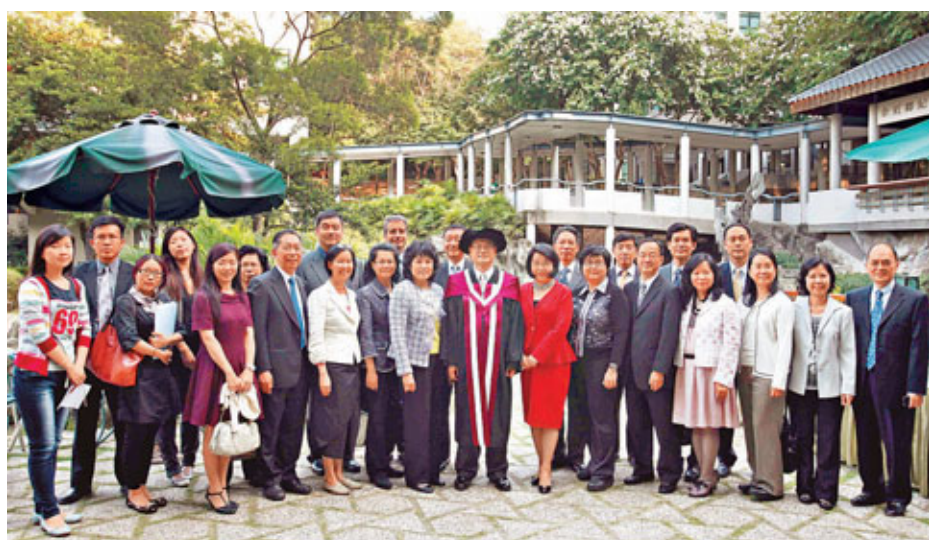
蔡冠深(前排右八)昨獲嶺南大學頒授榮譽社會科學博士，家人和朋友均到場祝賀，讓他非常感動。

香港文匯報訊(記者 劉景熙)嶺南大學昨日頒授榮譽博士學位予3位傑出人士，以表彰他們在本專業領域的成就，及對香港教育及社會的貢獻。新華集團主席、中華總商會會長蔡冠深獲頒榮譽社會科學博士。理文系列公司董事局主席李運強，及前大學教育資助委員會主席林李翹如，則分別獲頒榮譽工商管理學博士和榮譽法學博士。