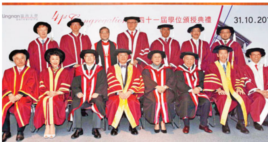
嶺南大學昨日頒授榮譽博士學位予3位傑出人士。蔡冠深(前排左三)獲頒榮譽社會科學博士；李運強(前排右三)及林李翹如(前排右四)，則分別獲頒榮譽工商管理學博士和榮譽法學博士。圖中前排左四為香港特首曾蔭權。