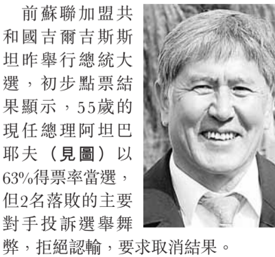
前蘇聯加盟共和國吉爾吉斯斯坦