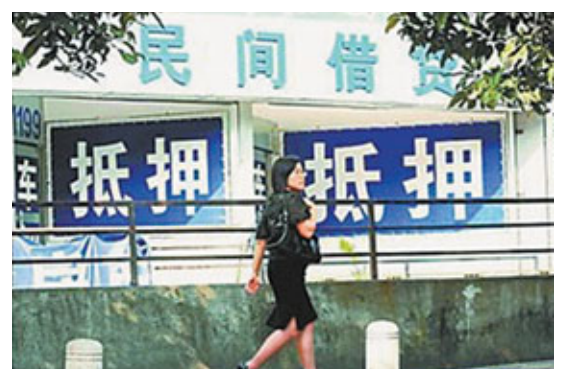
■溫州民間資本亟待復甦。

資本由「地下」走向「地上」的又一試點，該基金一旦運行正常便向溫州民間資本服務有限公司過渡。