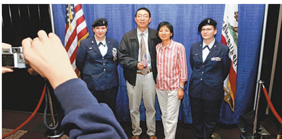
■新入美國籍的中國夫婦正在拍照。中國富豪階層熱衷移民及海外投資。

香港文匯報訊（記者 房慶 北京報道）中國銀行私人銀行與胡潤研究院日前聯合發佈報告指出，中國有近半數的千萬富豪正在考慮移民，有14%的人已付諸實施或正在申請移民中。這些個人可投資資產1千萬以上的人群中，擁有海外資產的人數已達到1/3，房地產成為他們的首選投資項目。而此前有報告稱，在中國的億萬富豪當中，有27%的人已經移民，有47%的人正在考慮移民。