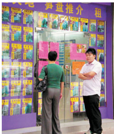
地產市道不振，中介公司唯有以勤補拙。

香港文匯報訊(記者 錢修遠 上海報道) 二手房市場陷入困境，上海有20%-30%中小中介閉關門。有地產代理為招攬生意，在代理銷售一手樓時深夜仍駐守樓盤拉生意，希望「能拉多少拉多少」，在慘淡的樓市交投中盡量維持生計。