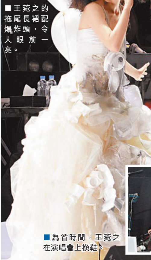
■王菀之的拖尾長裙配爆炸頭，令人眼前一亮。