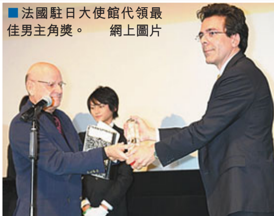
法國駐日大使館代領最佳男主角獎。網上圖片