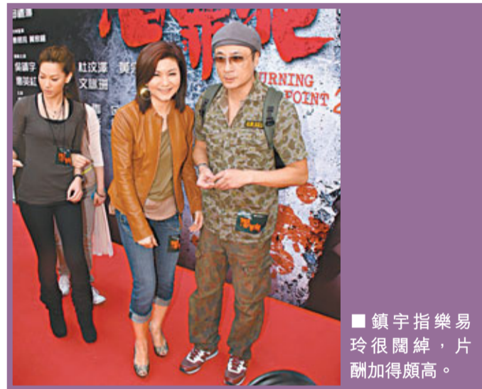
鎮宇指樂易玲很闊綽，片酬加得頗高。