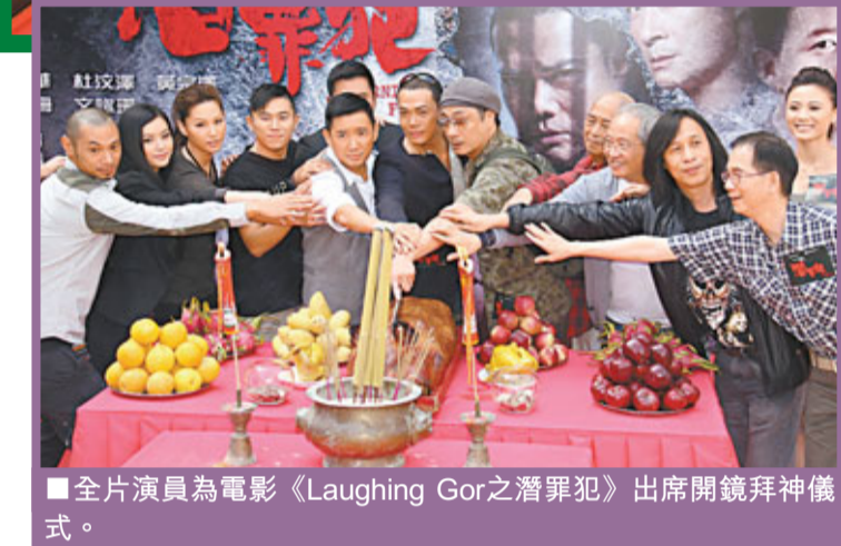
全片演員為電影《Laughing Gor之潛罪犯》出席開鏡拜神儀式。