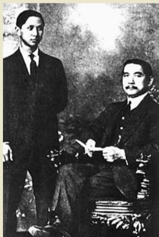
■孫中山與其子孫科的合照。

一九一一年後的辛亥革命不僅結束清朝二百多年的統治，亦結束了中國二千多年的帝制。一九一二年，中華民國成立，但革命的成果先後被袁世凱和軍閥篡奪，中國陷入分崩離析的局面，民國只是虛有其名，孫中山及其追隨者仍需要建設和平統一的共和中國而奮鬥。 孫中山於一九一七至一九二五年在廣州三度建立政權。雖然政治環境嚴峻，財政極度困難，但孫中山及其追隨者在廣州主政期間，仍竭盡所能地在廣州進行市政建設，改革教育及推動經濟，使廣州逐漸具備現代城市的雛形，為廣州往後更大規模的建設奠下基礎。 今年是辛亥革命一百周年，為紀念這重要的歷史事件，孫中山紀念館在孫中山大元帥府紀念館的支持下，特別舉辦「理想的追尋——辛亥革命後的孫中山與廣州」展覽，大家不但可藉此回顧孫中山在廣州三次建立政權的歷史及廣州在此段時期的發展面貌，亦可進一步了解孫中山在一九一一年後的革命道路，進一步體會孫中山及其追隨者不屈不撓的精神。