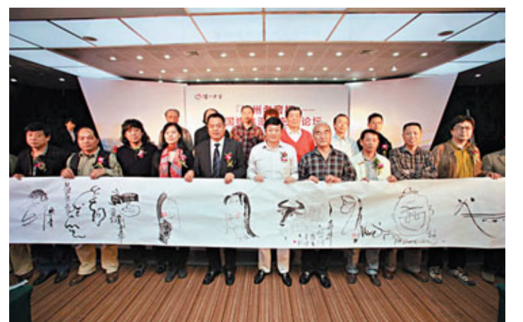
■漫畫藝術家在漫畫自畫像前合影。

這次展覽通過約一百件孫中山大元帥府紀念館及香港歷史博物館的館藏文物，介紹孫中山在廣州三次建立政權的歷史，以及在這個時期，孫中山及其追隨者為廣州及在建設、經濟發展、教育制度和民生等方面帶來的轉變。