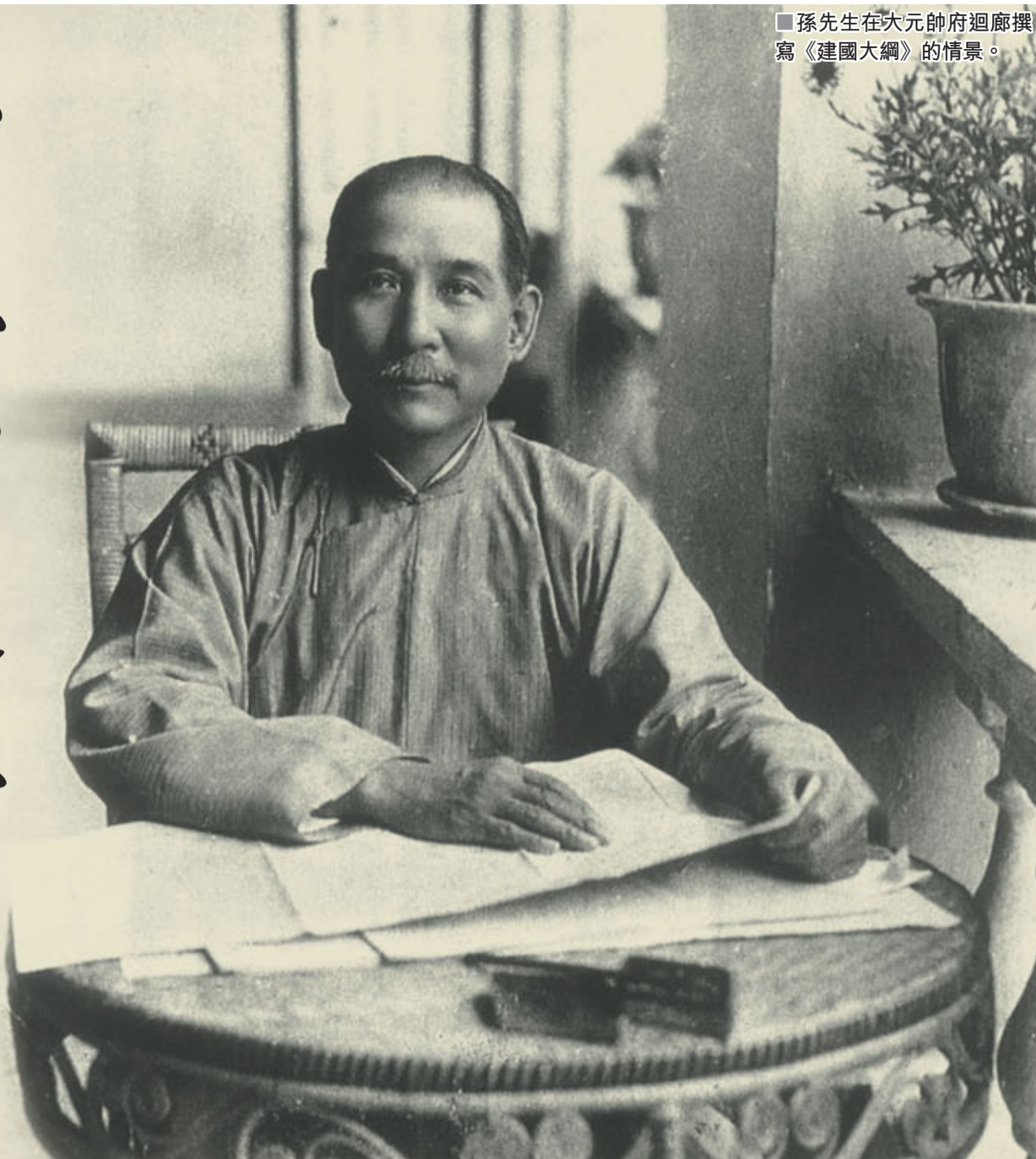
■孫先生在次元帥府迴廊撰寫《建國大綱》的情景。