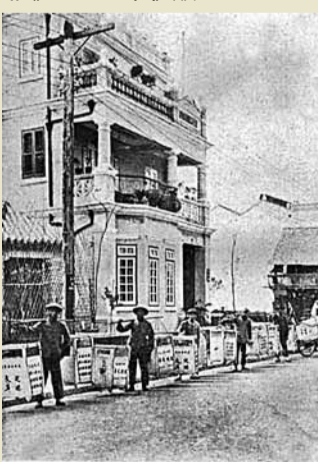
■1920年，廣州督學局仿外國巡迴圖書館辦法，設立巡迴文庫，以提升群眾的讀書風氣，普及文化知識。圖為穿街走巷的巡迴文庫。