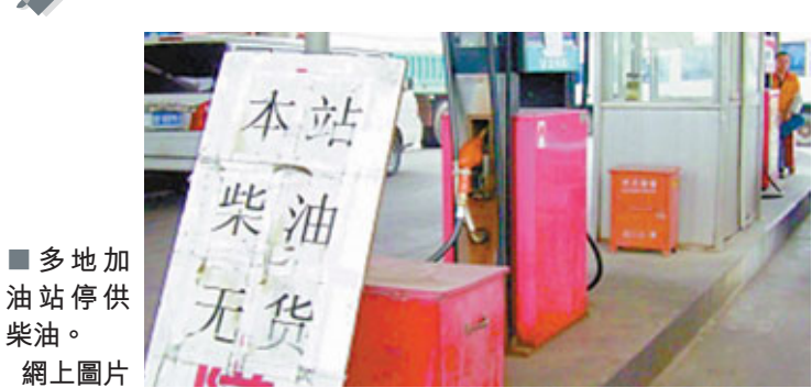
■多地加油站停供柴油。 網上圖片

香港文匯報訊 據新華社28日報道，近期，中國安徽、江蘇、湖北、山東等地柴油供應緊張形勢凸顯，在供求失衡、「批零倒掛」（批發價高於零售價）等因素交織下，眾多民營加油站陷入斷供、限購等尷尬境地，引起社會關注。