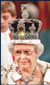
■伊利沙伯二世的王冠傳給威廉之女的機會大增。

英國王室制度翻開新一頁！歷時3天的英聯邦政府首腦會議昨日於澳洲珀斯揭幕，英國首相卡梅倫提出王位繼承權修改方案，廢除王位「傳次子不傳長女」制度，以及王位繼承人不可與天主教徒成婚的規定，向300年古舊傳統說再見。英聯邦成員國一致通過，意味威廉王子伉儷將來所生的第一個孩子，不論男女皆能繼承王位。