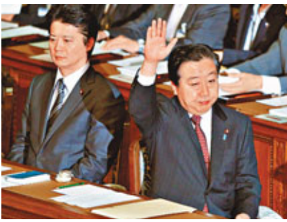
■野田佳彥在國會發言時揮手。

日本內閣昨日決定，為籌措「311」東日本大地震災後重建資金，將從下月起把首相野田佳彥、內閣成員及副大臣、政務官的新酬分別降低30%、20%和10%，以謀求國民對重建增稅的理解。 早前已出台的臨時特例法案規定，到2013年度底，國家公務員薪酬將平均削減