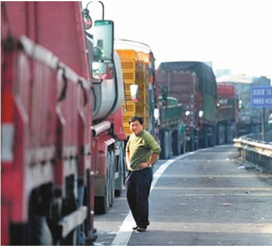
■浙江的加油站，等待柴油的貨車大排長龍。

中國能源網首席信息官韓曉平表示，近年來頻頻爆發「油荒」，無不與成品油調價相關。在政府定價下，調價屢屢和國際市場環境背離，加之調價依據不透明、消費者缺乏知情權等，說明中國目前的成品油定價機制尚不完善，相關改革迫在眉睫。