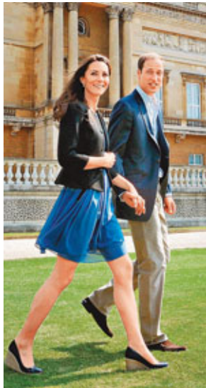
■威廉王子伉儷頭胎若生女，亦能繼承王位。 資料圖片

英國王室數百年的規定，在王位繼承次序上，長女必須處於次子之後；現時英女王伊利沙伯二世所以能繼承王位，則是由於他的父親喬治六世沒有兒子。此外，根據1701年的《王位繼承法案》，天主教徒不能繼承王位；英王喬治二世（1683年—1760年）的所有子孫，則須得到國君同意才能嫁娶。