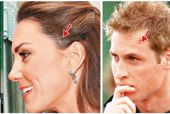
■凱特迎實時被發現頭上有3吋長的疤痕(左圖)。威廉額上有鋸齒形疤痕(右圖)。