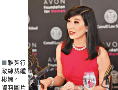
■雅芳行政總裁鍾彬嫻。 資料圖片

化妝品公司雅芳(Avon)面臨美國證券交易委員會(SEC)的兩項調查，同時由於無法達到預定的銷售目標，令華裔行政總裁鍾彬嫻的管理能力受到質疑。 聖母瑪利亞天主教價值基金高級副總裁兼投資組合經理海爾曼說，投資者快沒耐心了。雅芳周四在紐約的股價逆市暴跌18%，收於每股18.81美元，成交量是平均水平的7倍。 雅芳在提交給監管機構的備案文件