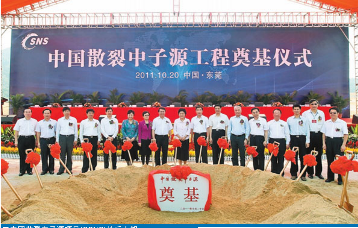
中國散裂中子源項目(CSNS)落戶大朗，劉延東、汪洋等領導出席奠基儀式。

今年9月，位於石龍鎮的廣東翠生藥業股份有限公司、廣東華南新藥創製中心與四川大學，三方簽署創新藥物技術合作協議，涉及治療糖尿病、腫瘤等疾病的多個創新藥物項目。這些項目均由四川大學「國家綜合性新藥研究開發技術大平台」研究。目前項目已石龍完成前期研究工作，並已申請國內或國際發明專利。石龍鎮相關負責人表示，