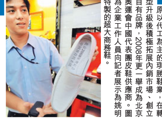
原以代工為主的琪勝鞋業，在轉型升級後積極拓展內銷市場，創自有品牌，2008年更一舉成為北京奧運會中國代表團皮鞋供應廠商。圖為企業工作人員向記者展示為姚明特製的超大商標鞋。

合作協議的簽署標誌着石龍鎮企業進軍化學、生物製藥，謀求戰略轉型。廣東省科技廳廳長李興華形容這次合作是「科研-加速器-資本-產業化」的有機結合，開創了產學研結合的新模式。像這些創新企業轉型的奇跡，每天都在東莞上演。借助這幾年轉型升級創造的良好軟硬環境，東莞各個專業鎮爭先恐後擦亮「東莞研發」、「東莞設計」、「東莞服務」的新名片，以專業鎮為代表的東莞產業集群已開始逐步向產業鏈高階奮力進軍。