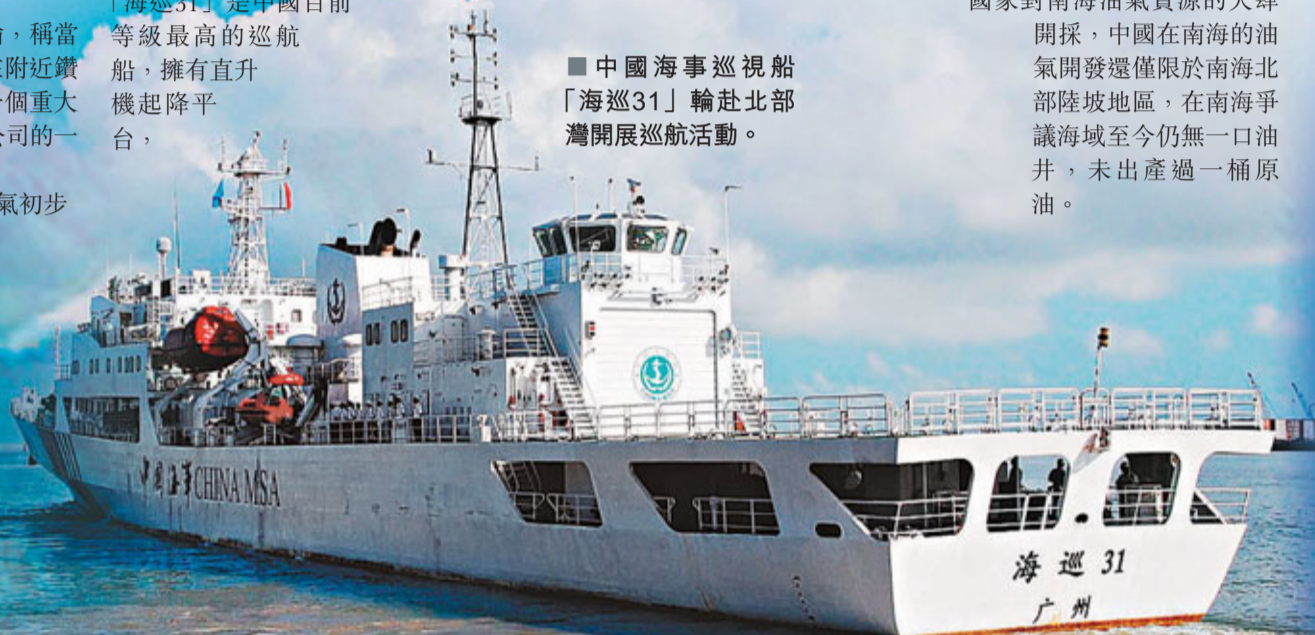
中國海巡巡視船「海巡31」輪赴北部灣開展巡邏活動。

26日，中新社記者在中國三省的北部灣海區聯合巡航出發儀式上注意到，「海巡31」、「海巡191」、「海巡192」等多艘海巡巡邏船艇參加了此次活動，其中來自廣東的「海巡31」是中國目前等級最高的巡邏船，擁有直升機起降平台。