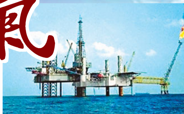
越南位於南海上的石油鑽井平台。

勘探合作協議，勘探地點就位於此次發現天然氣的中越爭議海域。此前，越南已與包括英國BP公司、美國康菲石油公司等在内的多家跨國石油公司簽訂合同，拉攏相關國家參與開發南海油氣資源。