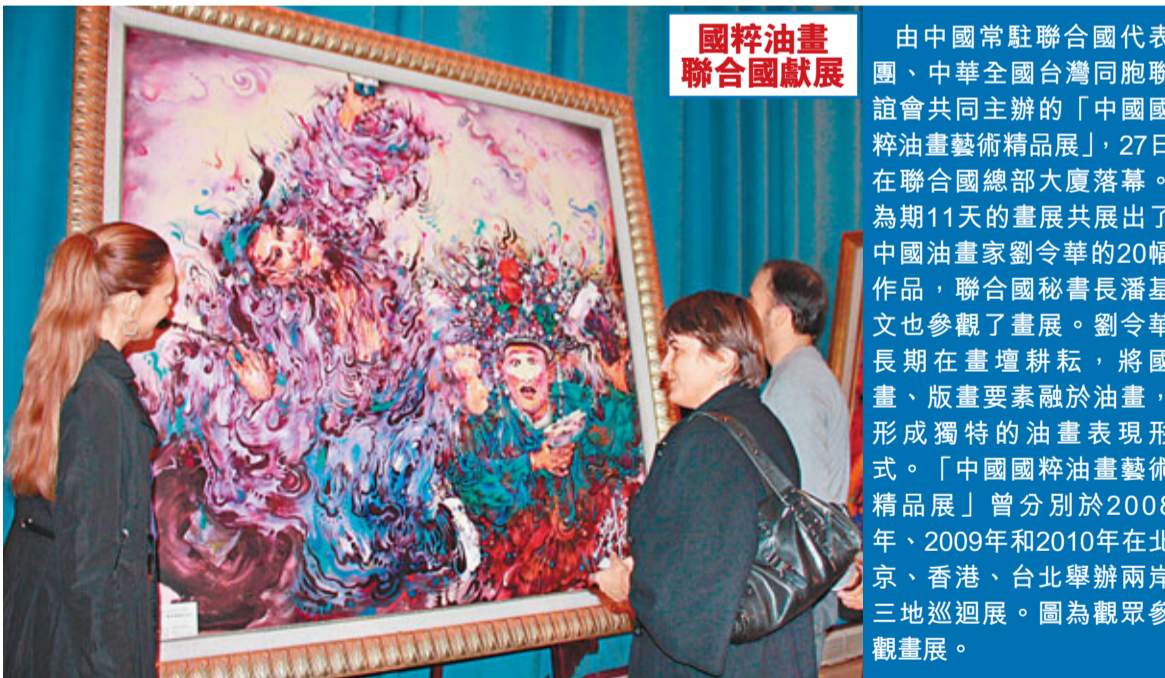
國粹油畫 聯合國獻展

泛亞鐵路從中國西南的昆明出發，經越南、柬埔寨、緬甸、泰國、馬來西亞，最後抵達新加坡，將中國與整個東南亞國家緊密聯結在一起。中國境內，泛亞鐵路分為東、中、西線，東線的路線是昆明—玉溪—蒙自—河口—越南河內；中線有兩條，一條是昆明—玉溪—普洱—景洪—泰國磨憨，另外一條是景洪—打洛—緬甸曼德勒；西線是昆明—大理—保山—瑞麗及保山—芒市—騰沖猴橋—緬甸密支那。目前，雲南4條國際大通道、5條省際大通道已全部建成通車。