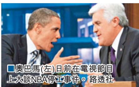
奧巴馬(左)日前在電視節目上談NBA停工事件。

公牛忠實球迷、美國總統奧巴馬對於 NBA 勞資雙方在聯邦仲裁與調解局介入下，至今仍未有取得任何實質進展感到不滿，並再次開腔希望勞資雙方能為球迷考慮，盡快結束停工。