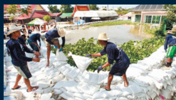
■士兵在一間寺廟外推沙包，可見右方的洪水快要超越堤頂。