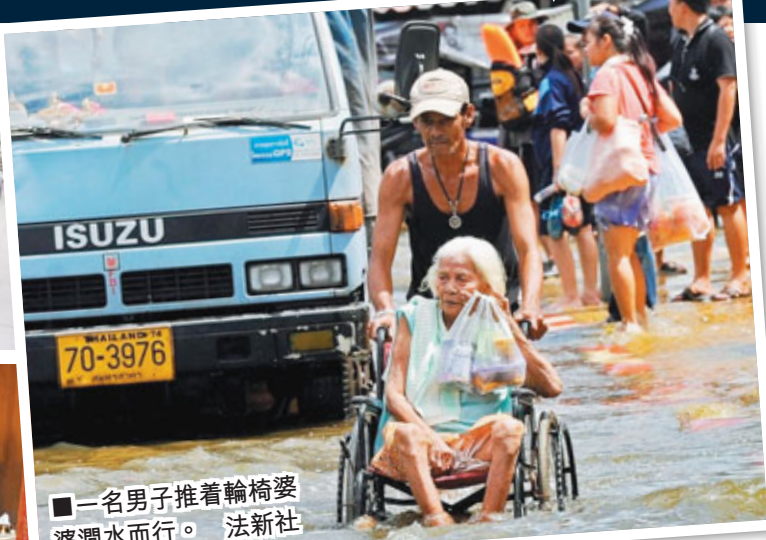
■一名男子推着輪椅婆婆澗水而行。