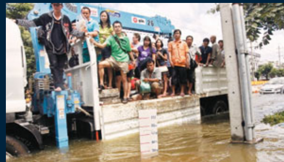
■居民站在大貨車上疏散，車前可見水位已升至60厘米。