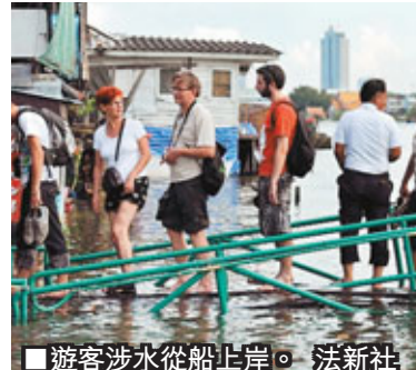
■遊客涉水從船上岸。

泰國水災惡化，恍如「慢海嘯」威脅曼谷，市內唐人街曾水浸至腳跟，有居於市中心的華人到芭堤雅暫避。市長素坤潘表示，洪峰昨日由北部湧抵曼谷，湄南河未來幾天水位或升至高出海平面2.6米，比沿岸堤防還要高0.1米。總理英祿前晚警告一旦防洪牆失守，曼谷低窪地區水深可能達1.5米。泰國抗洪救災行動中心斷言，曼谷將全城被浸，居民須接受現實。