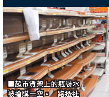
■超市貨架上的瓶裝水被搶購一空。