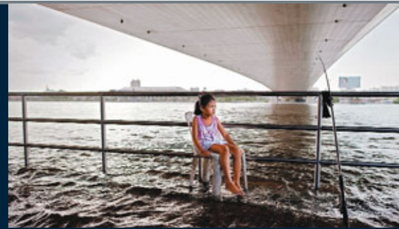
■一名女孩坐在湄南河畔，卻彷彿坐在水面上。