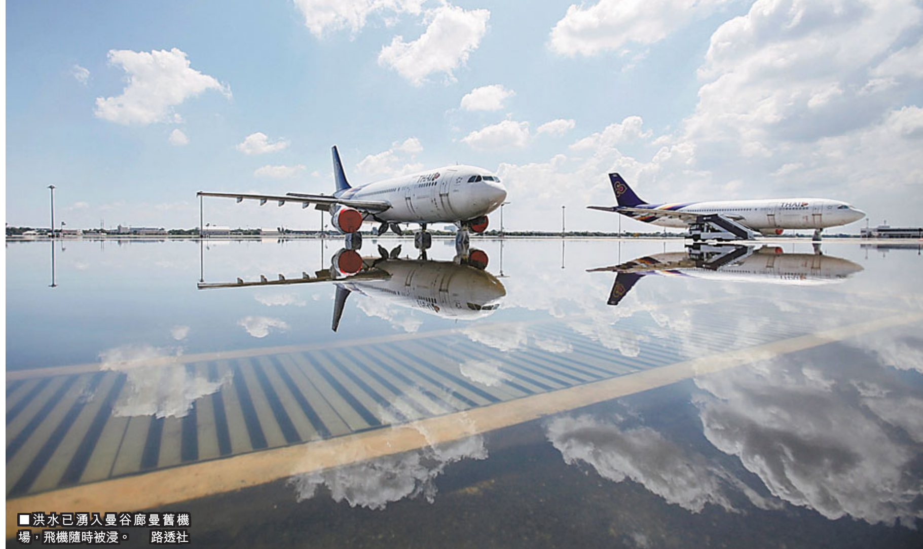
■洪水已湧入曼谷廊曼機場，飛機隨時被浸。