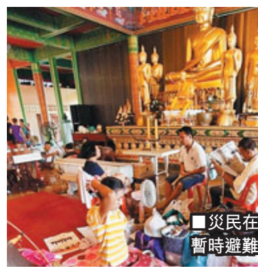
■災民在一間寺廟暫時避難。