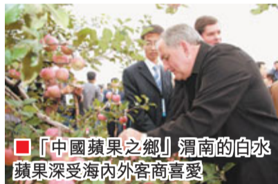
「中國蘋果之鄉」渭南的白水蘋果深受海內外客商喜愛

國家為了深入推進西部大開發，提出把「關中—天水經濟區」建設成為全國內陸型經濟開發開放的戰略高地，對西部地區屬於國家鼓勵類的產業，按15%稅率徵收企業所得稅。渭南作為「關中—天水經濟區」的次中心城市，到2020年城市建成區面積將達到100平方公里、人口達到100萬。國家所出台的鼓勵政策，對渭南來講，是一次難得的歷史性發展機遇；