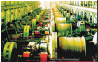
位於渭南市華縣的亞洲最大的鋁選礦磨浮車間