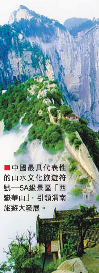
中國最具代表性的山水文化旅遊符號——5A級景區「西嶽華山」，引領渭南旅遊大發展。