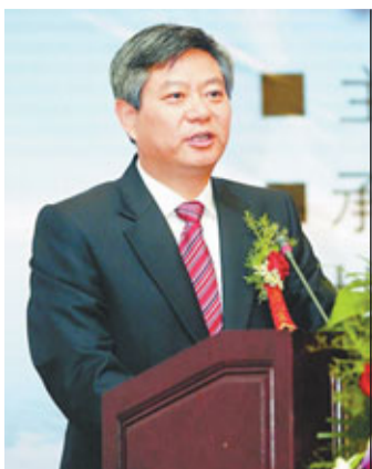
渭南市市長徐新榮

渭南是關中平原最寬闊的區域，土地平整，面積廣闊。特別是新規劃191平方公里的鹵陽湖現代產業開發區擁有1萬畝水面，3萬畝荒地，可直接轉為建設用地。工業用地價格每畝10