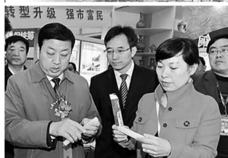
轉型升級 強市富民