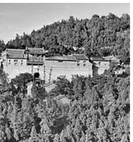
陳爐古鎮民風