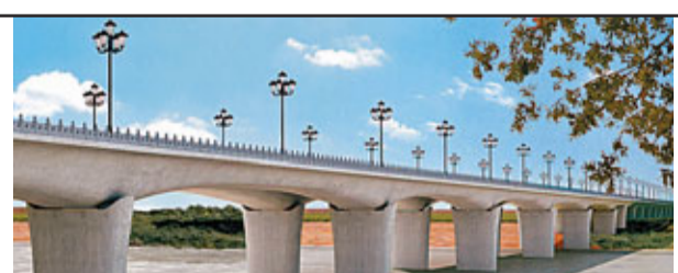
■秦漢新城重點樞紐工程——橫橋