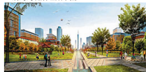
■城市與產業高度統籌，打造宜居宜業之城。