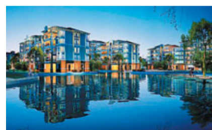
■完善的住房供應體系，實現「住有所居」、「居有所樂」。