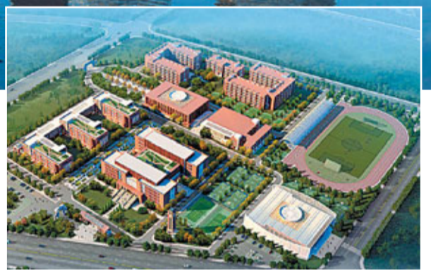
■秦漢新城清華中學鳥瞰圖

持「高端商務領銜、空港經濟對接、傳統產業拓展、現代服務支撐，文化創新為媒、綠色有機為場」的發展路徑。