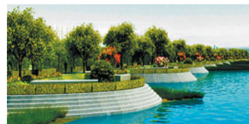
■渭河河堤治理效果圖