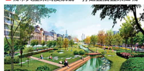
■歷史與現代交相輝映，休閒與商務兩相宜。