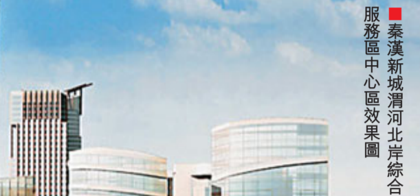
■秦漢新城渭河北岸綜合服務區中心區效果圖