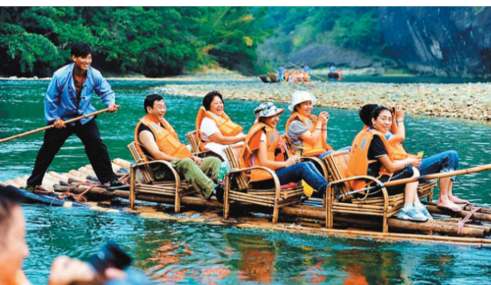
秋遊武夷 入秋以來,武夷山秋高氣爽,氣候宜人,吸引眾多中外遊人前來遊覽。圖為10月24日,遊客在福建武夷山九曲溪漂流。新華社

作為內地產茶大省的福建,市民閒暇之餘泡功夫茶的習慣已融入日常生活。隨著生活品味的提高,省內的烏龍茶、紅茶、白茶等各種類茶葉的高端產品層出不窮,但配套的茶道用品依然停留在瓷器、紫砂壺等傳統的器具上。雖然近年來部分作坊推出陶器類茶具讓茶人眼前一亮,但業界依然認為,茶與茶具之間的發展漸行漸遠,鮮有能體現當下茶藝需求的配套茶用品。