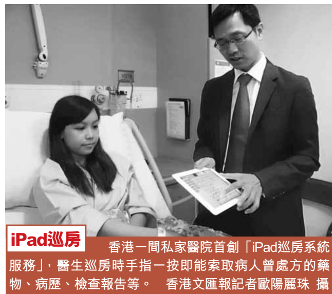
iPad巡房 香港一間私家醫院首創「iPad巡房系統服務」,醫生巡房時手指一按即能索取病人曾處方的藥物、病歷、檢查報告等。

香港文匯報訊(記者 嚴敏慧)香港「惡菌」橫行,昨日新增1宗耐藥性金黃葡萄球菌個案,以及4宗集體感染抗萬古霉素腸道鏈球菌(VRE)個案。其中,VRE個案在伊利沙伯醫院爆發,4名32歲至81歲的男病人受感染,所有病人目前情況穩定。