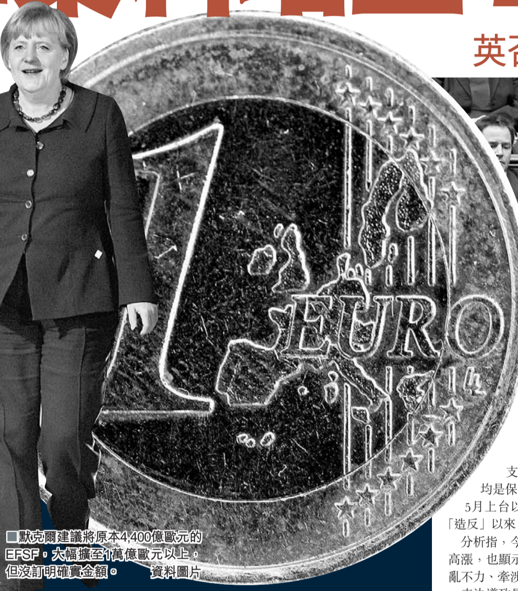
■默克爾建議將原本4,400億歐元的EFSF，大幅擴至1萬億歐元以上，但沒訂明確實金額。