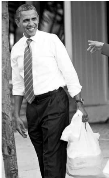
■奧巴馬前日在洛杉磯買外賣，再展親民「拉票」本色。

美國總統奧巴馬的刺刺激就業方案在國會碰壁，迫使白宮轉而推出可繞過國會的行政指令，瞄準經濟上脆弱環節之一的樓市，宣布一系列「負資產」業主援助改革，協助他們再做按揭，減少每月供款，讓他們有喘息空間。