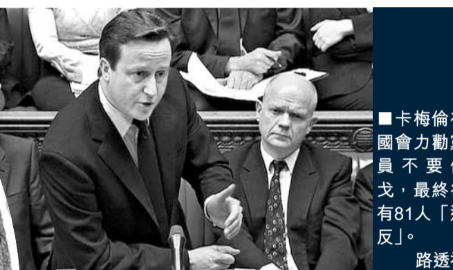
■卡梅倫在國會力勸黨員不要倒戈，最終卻有81人「造反」。

英國下議院前晚表決執政保守黨後座議員(無閣職議員)提出的「支持舉行英國脫離歐盟公投」動議，結果以111:483票大比數遭否決。