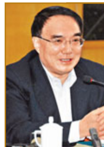
■遼寧是全國最早啟動市縣鄉黨委換屆的省份，亦於本月13日在全國率先完成省級黨委換屆。此次連任的遼寧省書記王珉，也成為出席六中全會的唯一一省「新書記」。

目前，各地正按照中央紀委、中央組織部「教育在先、警示在先、預防在先」的要求，將保證風清氣正工作做在歪風泛濫之前。竹立家認為，整肅換屆風氣，應特別注意三點：一是要體現公開透明，堅決履行公示制，選拔作風上過得硬、人民群眾信得過的幹部；二是要加大懲處力度，只要發現任人唯親、走後門、看面子的現象，堅決嚴懲不貸，並追查、問責，「重點查處典型案件能在黨內和社會產生良好的反響」；三是可考慮擴大提名權，擴大提名範圍。