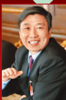
中共中央政治局委員、中央書記處書記、中組部部長李源潮（見圖）近期