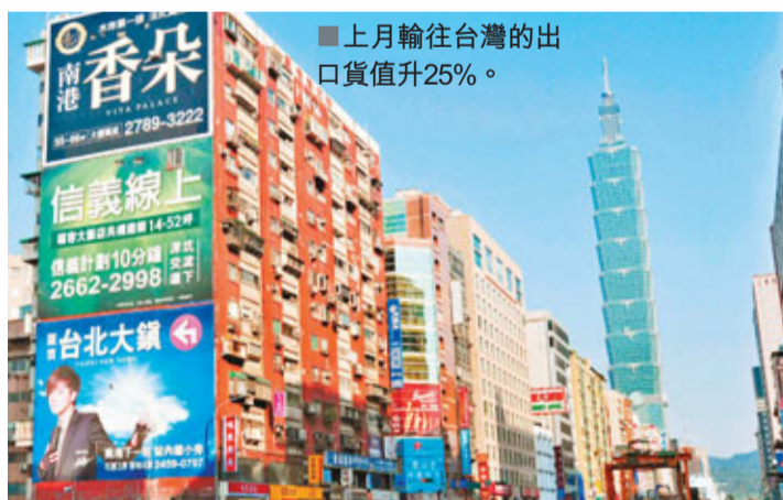
上月輸往台灣的出口貨值升25%。

香港文匯報訊(記者 廖毅然) 雖然本港9月份對內地及日本的出口貨值均見下跌,但數據顯示,本港的出口市場由以往依賴歐美等發達國家,逐步轉移至區內新興市場。