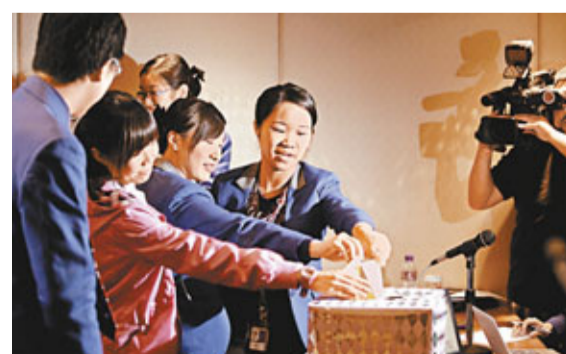
■怡中航空員工表決「工業行動」議案，以48:1通過，若本周四工會與資方第4輪談判無達成共識，將發動罷工或按章工作。

裂，工會不排除採取工業行動，包括罷工或按章工作。他續說，怡中是全港三大地勤服務公司之一，提供包括櫃位登記、登機閘口及行李處理等，現時約有400多名前線員工。若發動工業行動，估計約有200多名員工參與，屆時或會影響服務，甚至延誤航班，希望市民理解。