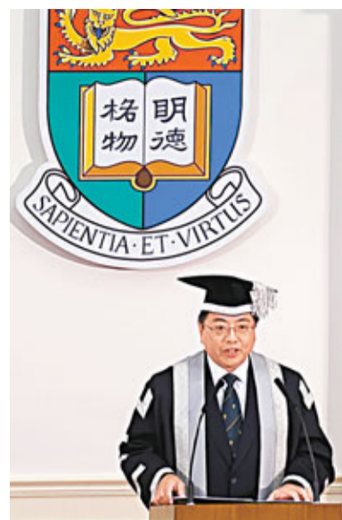
■徐立之突然致函校務委員會主席，指已決定於明年8月31日約滿後離開，不再續任。資料圖片

香港文匯報訊(記者 任智鵬、勞雅文)在香港大學服務9年的校長徐立之，近日突然致函校務委員會主席梁智鴻，指已決定於明年8月31日約滿後離開，不再續任。信中提到港大已歷百周年，新校長可為大學未來發展灌注新思維。梁智鴻對此大感惋惜，並深深感謝徐對港大作出的貢獻。在今年2月港大春茗時，徐立之曾透露，如有機會，有意繼續服務港大。港大校務委員會昨舉行會議，會上各成員均獲悉徐立之明年8月31日約滿後即離任的決定。他在給主席梁智鴻的信函中，表明無意續任，當中提到「過去百年港大曾經歷無數變遷，深信大學已做好準備，應付未來的機遇與挑戰，而一位新校長亦可為大學進一步成長及向前發展，帶來新思維及視野。」他又稱，為能與校內真誠投入及充滿熱情的同事並肩工作多年而深感榮幸，對大家共同努力的成果感到驕傲。徐立之昨晚透過電郵向全校師生、校友公布不續任的消息。他在電郵中表示：「我現已決定在約滿後不再續任，所以我希望你們是首批人士知道這個重要的消息。我深信香港大