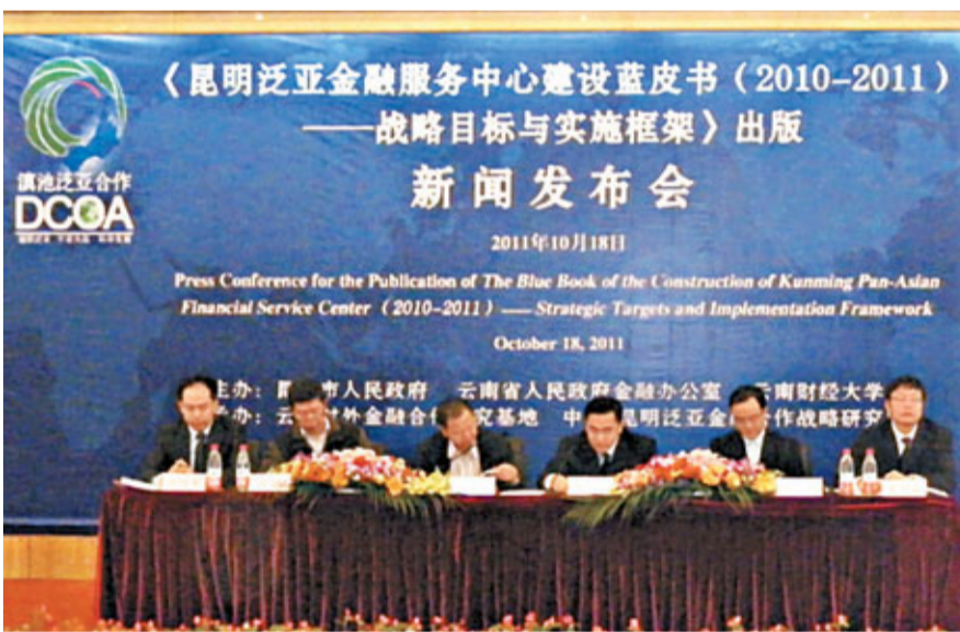
藍皮書新聞發佈會現場。

範區」即供應鏈金融示範區、農村金融示範區、開發性金融示範區。該書共11個章節，以「昆明泛亞金融服務中心建設」為主題，對中國昆明市、南寧市、成都市、重慶市、越南的胡志明市、泰國的曼谷市和新加坡等7個重點城市進行了多個角度的比較，論述了昆明市建設區域性國際金融中心的重要性。為昆明區域性國際金融中心建設提供了有利的智力支持，同時也標誌著昆明區域性金融理論體系開始確立。