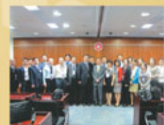
高級法官研修班學員參觀立法會並與立法會主席曾鈺成(前排右六)合照

研修班提供了一個平台供本地法律界,包括法官、在職律師,及學術界人士與內地高級法官展開雙向交流,讓香港社會直接認識並瞭解內地法官,本港法律界人士都鼎力支持。