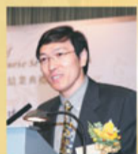
中華人民共和國外交部駐香港特別行政區特派員公署條約法律部主任田立曉博士