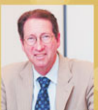
香港城市大學學務副校長 李博亞教授