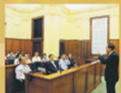
終審法院常任法官陳兆愷向高級法官研修班學員解釋香港就民事案件及刑事案件的上訴途徑