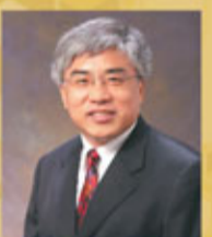
香港城市大學法律學院院長及中國法與比較法講座教授 王貴國教授