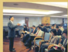
香港律師會會長何君堯向高級法官研修班學員介紹香港律師會