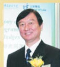
中央人民政府駐香港特別行政區聯絡辦公室法律部副部長劉新魁博士