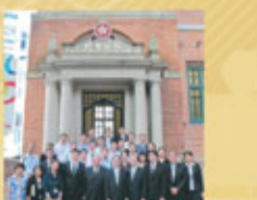
與香港終審法院首席法官馬道立(前排左五)、終審法院常任法官陳兆愷(前排右五)、高等法院原訟法庭法官杜港峰(前排右四)、署理首席區域法院法官潘兆童(前排右三)、九龍城裁判法院總裁判官唐文(前排右二)合照