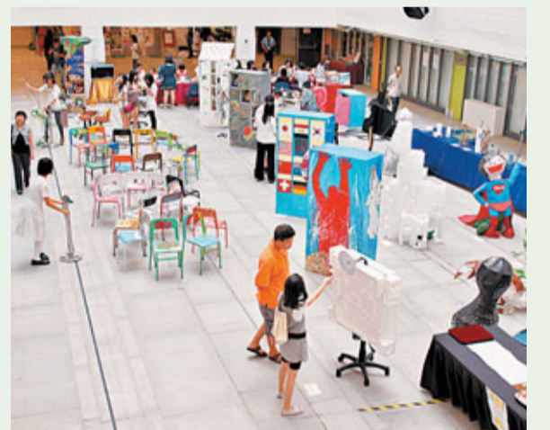
■文理書院(九龍)於本月初舉行展覽，展出多件由廢棄物變成的藝術品。

香港文匯報訊 (記者 歐陽文倩) 廢棄的儲物櫃、破損的椅子、電腦的包裝盒等校園廢物，本應送往垃圾堆填區，但一眾文理書院(九龍)的師生校友，竟將它們來個大變身，成為可登大雅之堂的藝術品，早前更在賽馬會創意藝術中心中央庭園舉行「活力澎湃 藝術世界」文理書院(九龍)師生校友藝術作品展。