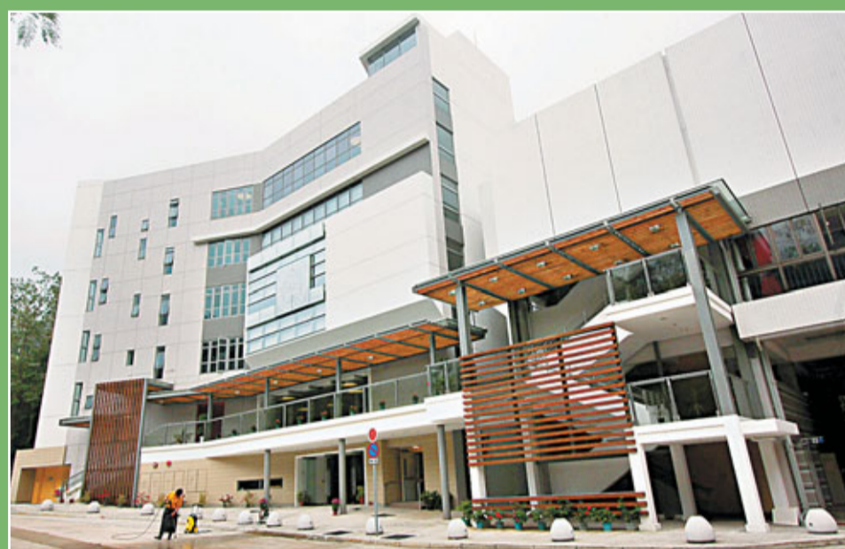
■恒生商學書院計劃於小瀝源興建大樓的建築費，亦由最初估計的6億至7億元，增加至9億至10億元。圖為香港恒生商學書院現有校舍。

另外，院校亦會從節流入手，新大樓將採用簡約設計，透過環保節能，減少開支。她建議政府日後繼續推出配對基金以及申請貸款時，同時考慮多種不明確因素。