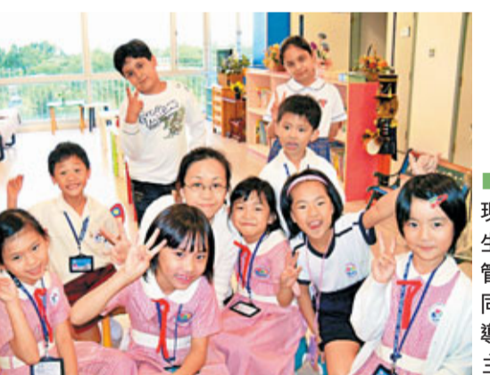
■「晴天計劃」現為區內小學生提供課後託管服務，並由同區中學生指導功課。

故有關計劃會安排伯裘書院派出的中學生義工協助「隱蔽家長」解決孩子的學業問題，另一方面社工則