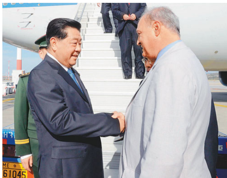
應希臘議會的邀請,賈慶林23日抵達雅典國際機場,開始對希臘進行為期5天的正式友好訪問。希臘議會第一副議長尼奧蒂斯在機場迎接。

德國是賈慶林主席此次歐洲之行的最後一站。德國是歐元區重要經濟體。中國與德國1972年建交,建交後各方面關係總體發展順利。目前雙方互為在各自所在地區的最大貿易夥伴。2010年雙邊貿易額達1,424億美元,佔中國對歐洲貿易總額的三分之一。今年6月,中國國務院總理溫家寶訪問德國,與德方進行了兩國首輪政府磋商,在科技、文化、尤其是經濟合作領域達成諸多共識。賈慶林主席此次訪將落實有關磋商成果,進一步提升中德戰略合作水平。