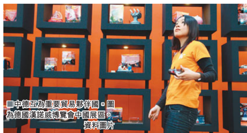
中德互為重要貿易夥伴國。圖為德國漢諾威博覽會中國展區。資料圖片

香港文匯報訊(記者 劉越山 北京報道)全國政協主席賈慶林23日上午乘專機離開北京,對希臘、荷蘭、德國進行正式友好訪問。這是中國領導人今年對歐洲展開的又一次重要訪問。有專家表示,當前,歐洲深陷債務危機,此次中國領導人適時到訪,一方面將實地了解歐洲債務危機的發展和影響,另一方面亦是以實際行動再次傳遞對歐洲的支持和信心。