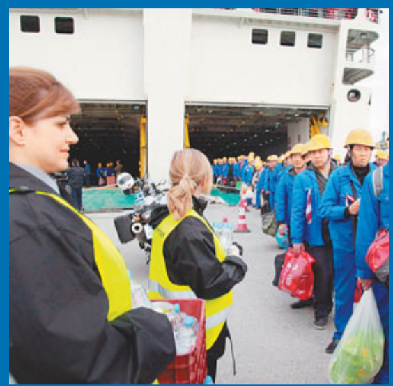
今年3月,中國同胞順利從利比亞搭客輪撤離至希臘克里特島。資料圖片

2012年是中德建交40周年,中國將在德國舉辦「中國文化年」活動,全面、深入地與德國民眾介紹中國悠久、璀璨的文化,將更有力的增進兩國人民之間的了解和友誼。