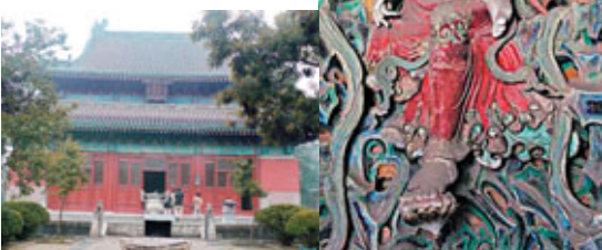
■正定隆興寺內佛殿 ■魯迅譽為「東方美神」的倒坐觀音