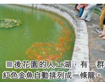
■後花園的人工湖，有一群紅色金魚自動排列成一條龍。

大悲閣右側的轉輪藏閣，下層地板上有一圓池，池中是一座直徑達7米的八角形木製轉輪藏，這座能轉動的藏經櫥，在北宋時期主要用來收藏經書，且在做法事時可以邊轉動法輪邊誦經，取佛教中法輪常轉之意，為我國最早的藏經櫥遺物。