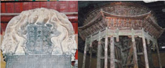
■隋朝龍藏寺碑最為著名珍貴 ■大悲閣右側的轉輪藏閣