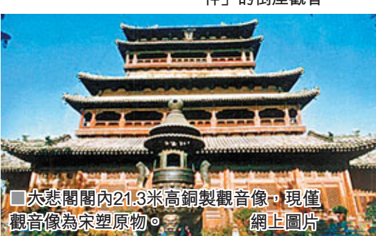
■大悲閣閣內21.3米高銅製觀音像，現僅觀音像為宋塑原物。 網上圖片