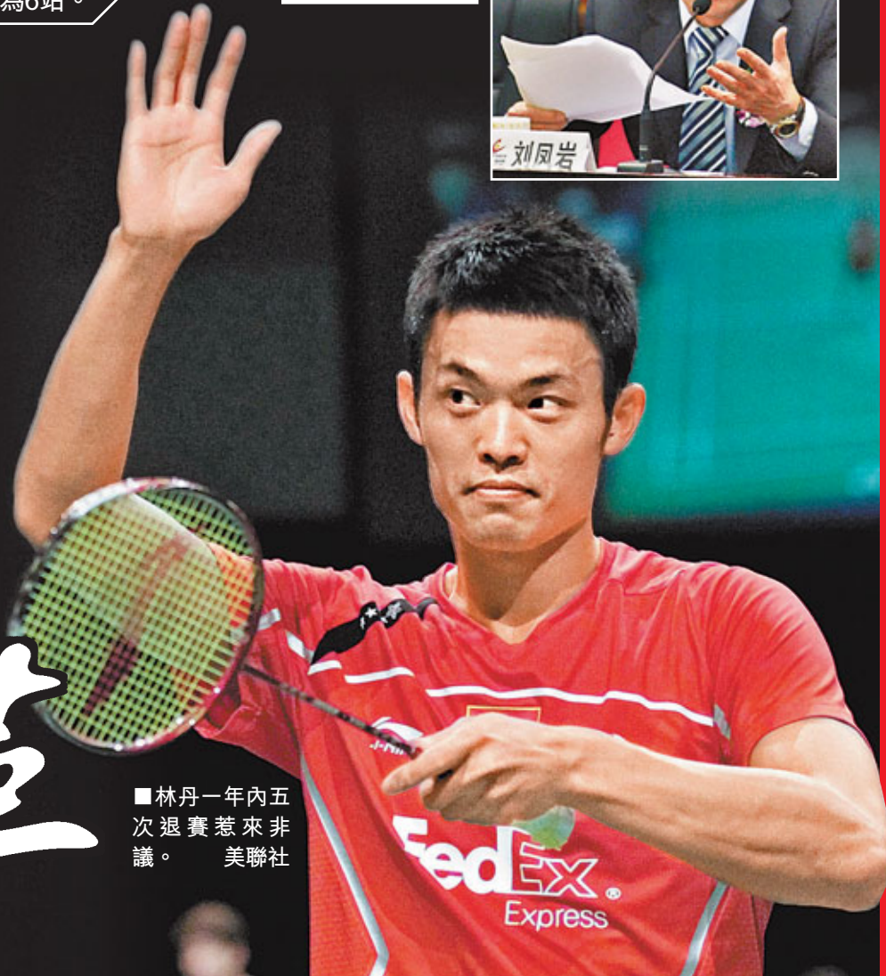
林丹一年內五次退賽惹來非議。