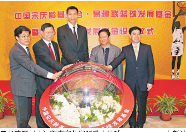
易建聯（中）與嘉賓共同觸動水晶球。