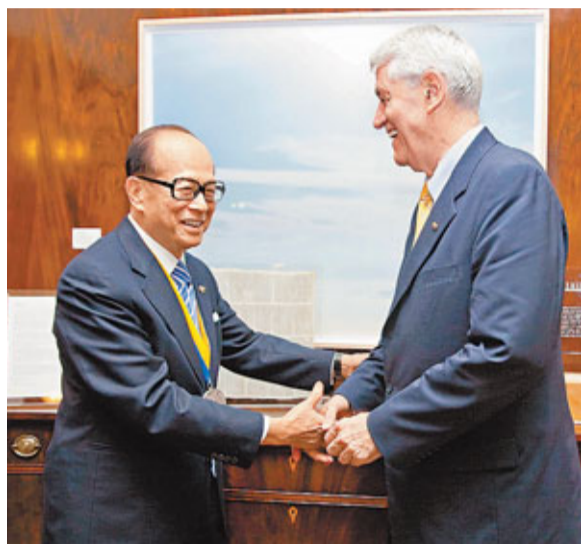
包信樂向李嘉誠頒贈最高榮譽柏克萊獎章，表揚他對社會的貢獻。

香港文匯報訊(記者 鄭治祖) 柏克萊加州大學李嘉誠生物醫學和健康科學中心於美國時間10月21日星期五揭幕，為致力解開致命疾病謎團的生物醫學研究，展開新的一頁。新落成的20萬平方呎大樓，將成為校園內的跨學科研究基地，聯繫不同領域的醫學研究，除研究病徵外，更探討如何防範如癌症、老年癡呆症、愛滋病、肺結核等疾病的致病根源。