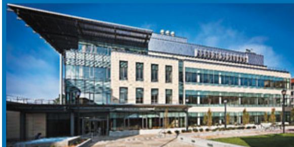
位於柏克萊加州大學的李嘉誠中心外觀。