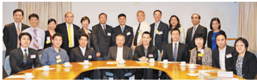
仁濟醫院董事局成員同孫明揚(前左四)合照。

香港文匯報訊 仁濟醫院第四十四屆董事局成員聯同該院屬下的中小學校長於日前拜訪教育局局長孫明揚、政治助理楊哲安、政務助理郭穎詩、新聞秘書江錦慧和專業發展及培訓首席教育主任康陳翠華，雙方就多個熱門教育議題交換意見，會見氣氛和諧融洽。