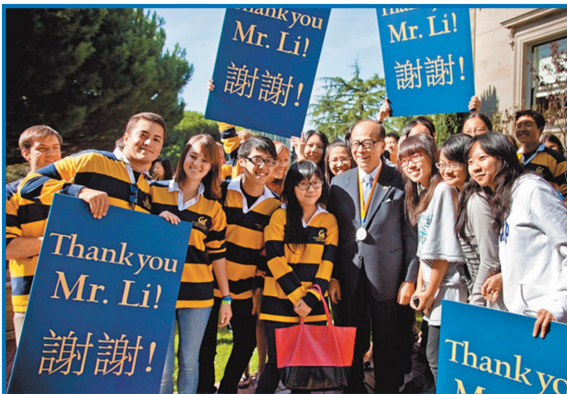
李嘉誠出席中心開幕典禮時，被柏克萊加州大學的學生熱情包圍。

研究中心首任主管錢澤南教授指出，柏克萊加州大學「走在現代醫學新世代的前沿。現代生物學對人體運作的認識，已到達了一個非常精確的程度，將為醫