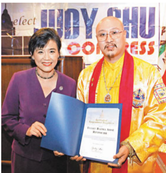
美國華人眾議員趙美心頒授美國國會表彰予祖古白瑪奧色仁波切。

另外，在祖古白瑪奧色仁波切訪問美國加州期間，首位華人美國眾議院國會議員趙美心頒授美國國會表彰予祖古白瑪奧色仁波切。