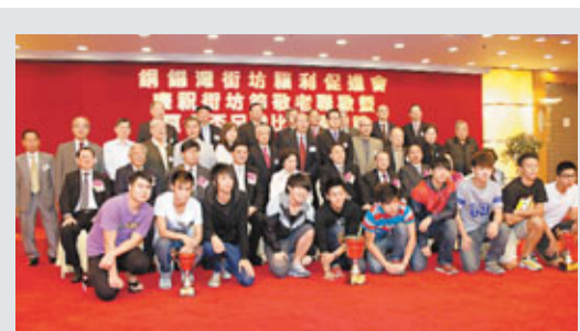
銅鑼灣街坊福利促進會舉行敬老聯歡會，賓主合照。

柏克萊加州大學李嘉誠生物醫學和健康科學中心屹立於校園西面入口處，由數幢研究與教學大樓合攏四邊組成，可容納450名研究人員。來自世界各地的科學家雲集於此教學及研究，並教導學生有關生物與疾病的根本結構，針對複雜的癌症問題、腦部疾病、全球致命的傳染病、幹細胞生物學等。中心將於來年春季學期正式開放給本科生和研究生使用。