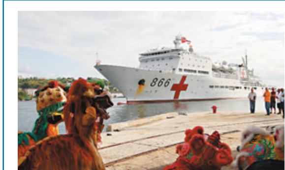
■「和平方舟」號駛入哈瓦那港口，受到當地華人華僑舞龍獅歡迎。