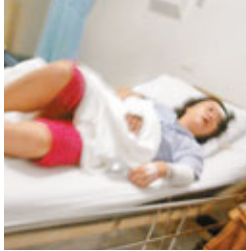
■22日，在泰國普吉國際醫院，一名傷者躺在病床上。

聯繫，保證對中國遊客的救助順利進行。 另據了解，發生車禍的巴士是由普吉市前往珊瑚島觀光途中發生側翻的，當時車上中國遊客共有26人，包括25名遊客和1名領隊。據泰國當地媒體報道，除26名中國遊客外，車上還有5名泰國當地司機和導遊。報道稱，巴士因為剎車失靈失去控制，墜入路邊5米深山溝。