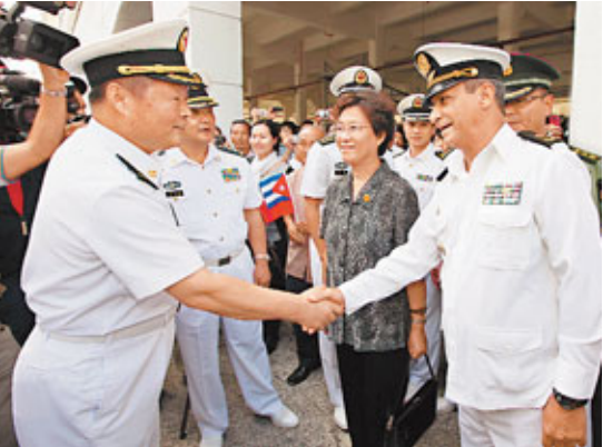
■古巴革命海軍副司令佩德羅·羅曼海軍上校（前右）在碼頭迎接中國海軍來訪。