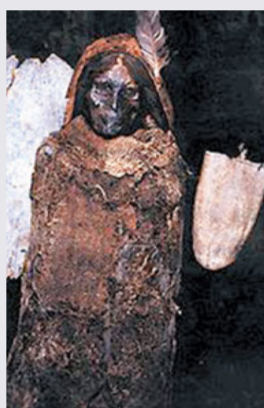
「樓蘭美女」面目清秀。

香港文匯報訊(記者 尹文娟 鄭州報道) 20日，在河南博物院東臨展廳內，名為「大漠文明絲路遺韻」的新疆出土文物展開幕。