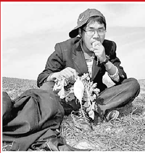
小宋餓了，就在路邊隨手拔個蘿蔔充飢。

香港文匯報訊(記者 尹文娟 鄭州報道) 橫渡長江、黃河，隻身走長城、翻雪山、過草地、深入無人區。