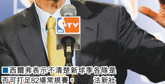
■西爾弗表示不清楚新球季各隊是否可打足82場常規賽。

儘管有聯邦仲裁與調解局的協調，NBA勞資協議談判一連三天在紐約經過逾30小時的博奕，周四依然是無果而終，這意味著聯盟有可能取消更多的常規賽。一連兩天在勞資談判中唇槍舌劍24小時的69歲NBA總裁斯特恩，當日更因患感冒而被送回家休息。