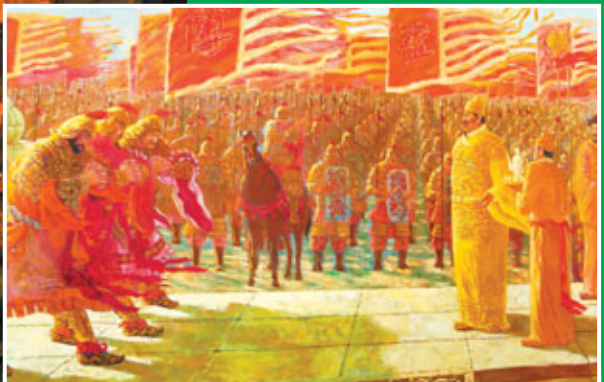
■1381年，朱元璋眾將軍率師三十萬分兩路直下雲貴，史稱「太祖平滇」。