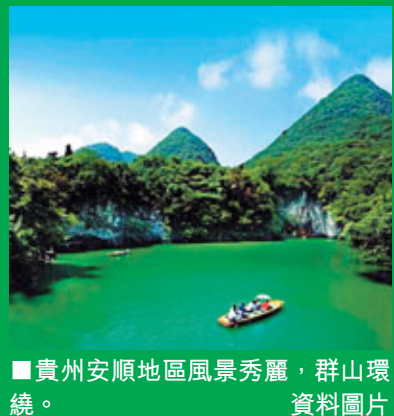
■貴州安順地區風景秀麗，群山環繞。資料圖片