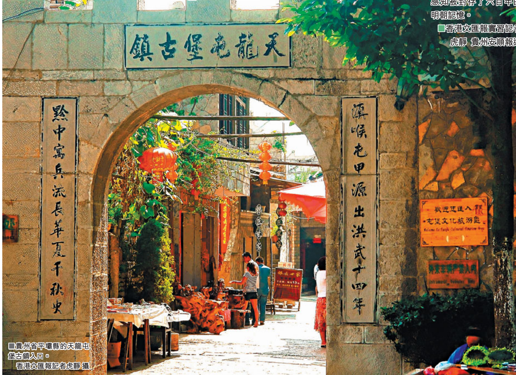
■貴州省平壩縣的天龍屯堡古鎮入口。

貴州省安順市所轄天龍、九溪、本寨等地，至今仍聚居着一支與眾不同的漢族群體，外界將其稱為屯堡人。據史料記載，屯堡人實明朝屯軍後裔，至今已歷經六百多年世事滄桑。屯堡作為明朝漢族文化延續的「活化石」，在黔中，村寨、服飾、地戲和風俗信仰如今還存在，光彩依然。在屯堡，歷史竟真的與現實並肩佇立。