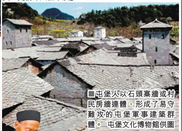
■屯堡人以石頭築牆或村民房牆連體，形成了易守難攻的屯堡軍事建築群體。