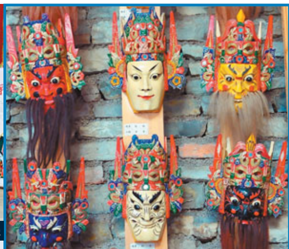
■屯堡面具面相分文、武、老、少、女五類，俗稱「五色相」。

「屯堡」一詞最早出現在清咸豐元年（公元1851年）安順府署纂修的《安順府志·地理志·風俗》中，記載有：「郡民皆寄籍，唯寄籍有先後。其可考據者，屯軍堡子，皆奉洪武敕調北征南。當時之官，如汪可、費壽、陳彬、鄭琪作四正，領十二操屯軍安插之類，散處屯堡各鄉。家口隨之至黔。」