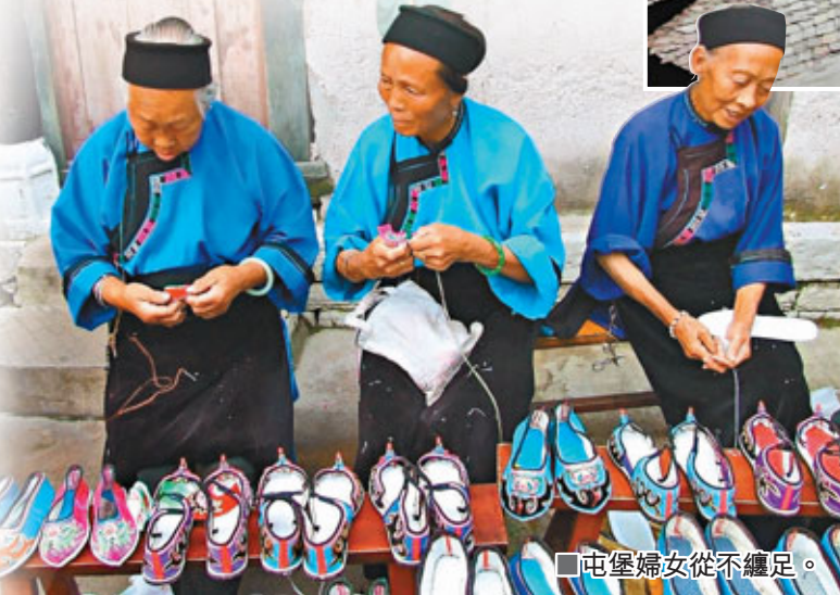
■屯堡婦女從不纏足。

據了解，由於屯堡人大部分來自江淮，服飾作為屯堡一道獨具特色的風景，與現今南京博物館所藏明代服飾與髮式相似，它傳達出了屯堡人江淮刺繡細膩、舒展、流暢和對祖先遺留文化的頑強堅守和傳承。