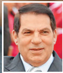
突尼斯前總統本·阿里

薩利赫6月於總統府被反對派炮彈炸傷，多月以來一直在沙特治療，9月底回國後觸發新一輪暴動。■《紐約時報》