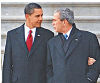
美媒讚奧巴馬有限度介入的「新戰爭模式」比布什更具效率。