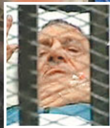
埃及前總統穆巴拉克