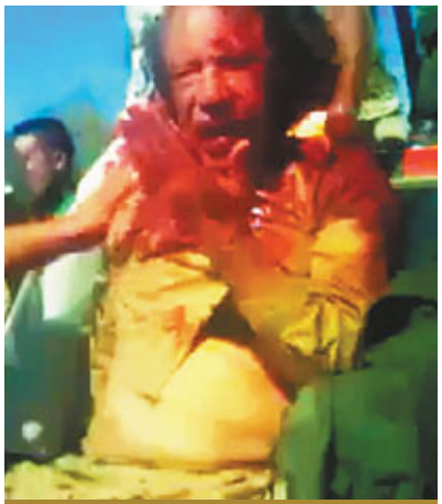
■卡扎菲被圍毆時，用手抹走面上鮮血。

網友InfiniteDice則表示，「慶祝任何死亡都是恐怖的事；他的死亡對利比亞人民或許是件好事，但沒有必要反應得像一群精神病患者一樣」。