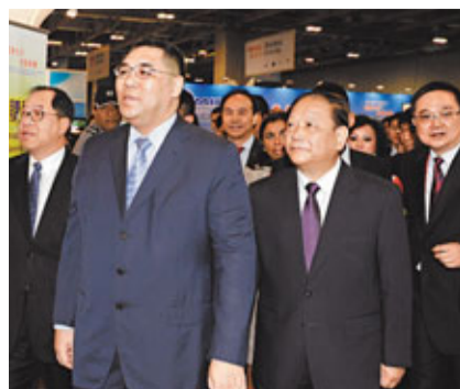
崔世安巡視第16屆澳門國際貿易投資展覽會展館。

香港文匯報訊(記者 王海濤、林婉琪、李潔穎 澳門報導)以「促進合作，共創商機」為主題的第16屆澳門國際貿易投資展覽會(MIF)昨日開幕，來自60多個國家和地區的350個代表團參加，展會規模為歷屆之冠。澳門經濟財政司司長譚伯源表示，澳門將貫徹中央「十二五」的發展規劃，逐步將澳門發展成為世界旅遊休閒中心和區域商貿服務平台。