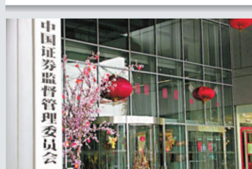
中國證券監督管理委員會。資料圖片

香港文匯報訊 為配合發展文化產業，中國證監會昨日表示，將創造條件支持符合條件的文化企業發行上市，鼓勵文化類上市公司進行併購重組，並穩步擴大其債券市場融資水平。