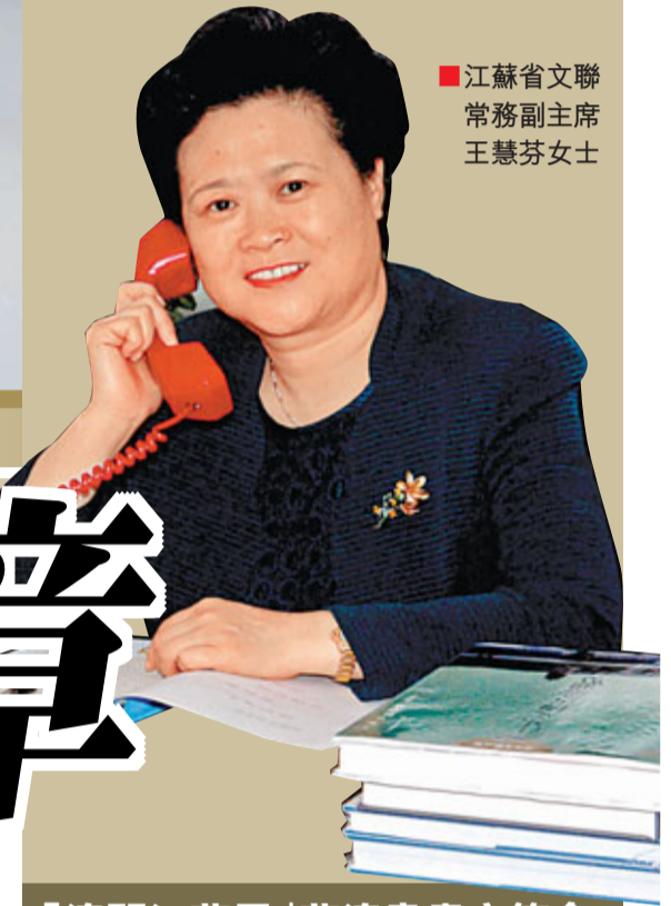
■江蘇省文聯常務副主席王慧芬女士

此次「澳門江蘇周」期間，由江蘇省文聯和澳門文化局承辦的蘇澳書畫家筆會，於10月22日在澳門旅遊塔會展中心舉行。此前，香港文匯報特別專訪了江蘇省文聯常務副主席王慧芬女士。