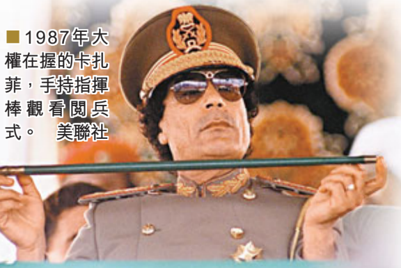
■1987年大權在握的卡扎菲，手持指揮棒觀看閱兵式。