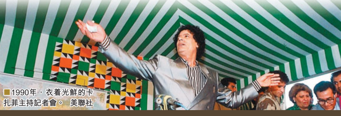
■1990年，衣着光鮮的卡扎菲主持記者會。