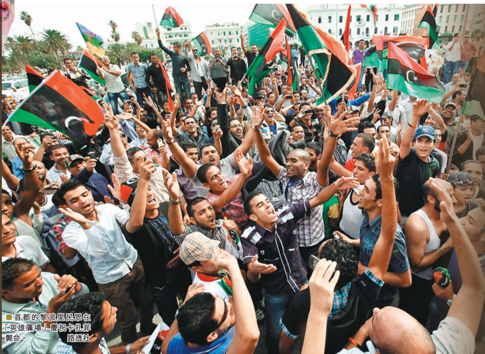
■首都的黎波里民眾在「英雄廣場」慶祝卡扎菲斃命。