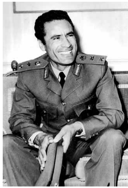
■1969年，27歲的卡扎菲成為利比亞領袖。