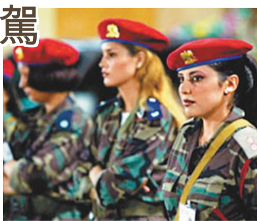
■卡扎菲的美女保鏢。

卡扎菲喜歡稱自己為「女性解放者」，在他擔任領袖期間，女性地位得以提高，而其轄下的衛隊，也清一色由女兵組成。這些女兵全部自軍事學院畢業，受過嚴格軍事訓練，個個身手高強，射擊技術精湛，最重要是對卡扎菲忠心不二，不惜以死來護主。2009年當卡扎菲訪問意大利時，便帶同