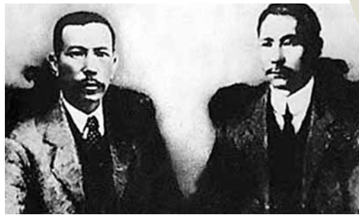
陳嘉庚(左)與孫中山。資料圖片