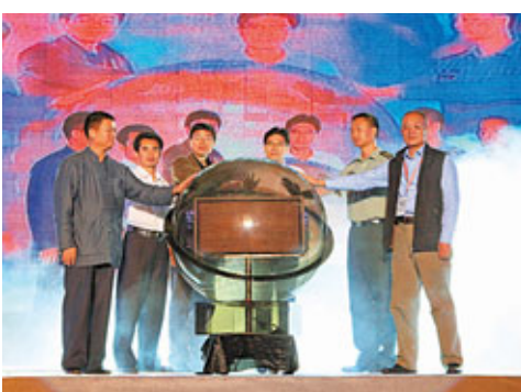
羅浮山道教文化旅游節開幕。

據了解，本次旅遊節18日晚在羅浮山門樓前廣場舉行開幕式，並將舉行道教文化表演、《羅浮仙路》啟動儀式、《羅浮傳奇》舞台劇首映禮，以及邀請了鳳凰衛視知名文化學者王魯湘、羅浮山管委會領導和旅行社代表開展「對話羅浮」活動、為羅浮山的旅遊發展建言獻策等活動。19日，在羅浮山舉行「龍脈仙山，祈福平安」大法會，並在當天免費開放朱明洞景區，廣邀遊客走仙路、賞仙山、結仙緣，親身體驗羅浮山的仙山文化。