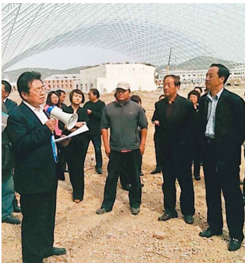
■香洲田園城項目已累計完成投資30億元人民幣。圖為大連市副市長孫廣田(右一)在溫泉項目新址上聽取匯報。

孫廣田說,大連溫泉旅遊要帶着好的概念和項目走出去,以大開放的格局吸引國內外旅遊大企。目前,大連旅遊位次提升,發展勢頭強勁,十大工程建設順利,溫泉旅遊產品開發勢頭看好,鄉村遊更加火爆。誠邀香港旅遊名企參與到遼寧建設溫泉旅遊大省的開發洪流中來,也希望香港遊客多來大連感受北方冬季溫泉的魅力。