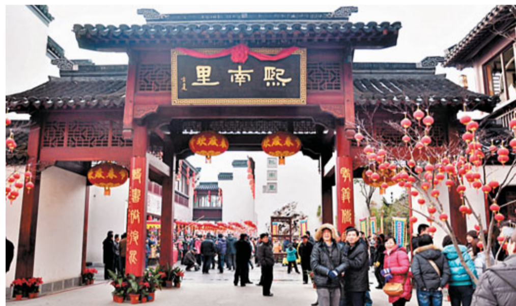
南京大學文化與自然遺產研究所團隊參與熙南里歷史文化街區的開發及利用。