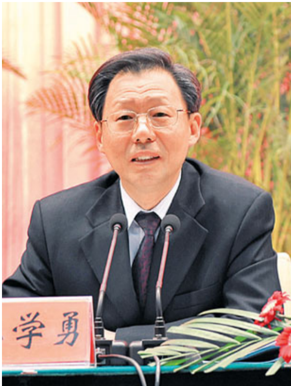
江蘇省省長李學勇明天將會在澳門旅遊塔會展中心主持「澳門江蘇周」開幕式。

據介紹，江蘇與澳門各有優勢，在許多方面互補性很強。特別是在中央政府與澳門簽署CEPA協議後，蘇澳合作和交流更呈現出蓬勃發展的勢頭。去年，江蘇對澳門進出口總額6,236萬美元，增長8.7%，其中出口5,921