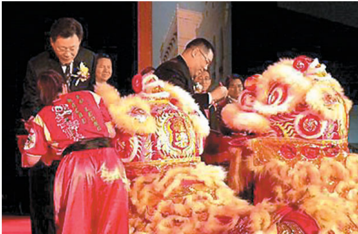
在今年3月16日於南京舉行的「江蘇澳門周暨活力澳門推廣展」開幕式上，江蘇省省長李學勇與澳門特區行政長官崔世安一起為獅子點睛。

另一方面，兩地旅遊往來人數大幅增長，去年經旅行社，江蘇赴澳門旅遊的人數達12萬人次，澳門赴江蘇旅遊的人數達7.2萬人次。文化交流合作方面，江蘇注重利用本地特色文化資源，積極開展與澳門地區的文化交流與合作。