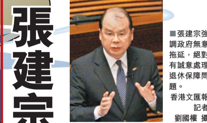
張建宗強調政府無意拖延，絕對有誠意處理退休保障問題。