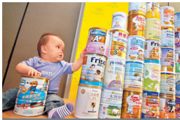
奶粉被揭發「作大」每日建議飲用量，導致兒童肥胖問題。

香港文匯報訊(記者 嚴敏慧) 香港各大品牌的兒童奶粉，被揭發「作大」每日建議飲用量。衛生署表示，1歲以上兒童每日飲奶不應多於360毫升至480毫升(即兩杯)，但市面銷售適合1至3歲兒童飲用的配方奶粉，大部分的建議份量均「超標」，其中最少兩個品牌建議每日飲用720毫升，較國際標準上限高一倍。署方強調，配方奶粉並非逾1歲兒童主要食糧，飲用過多會導致熱量攝入過量，導致肥胖等問題，亦會令兒童減吃其他食物，阻礙均衡營養吸收。