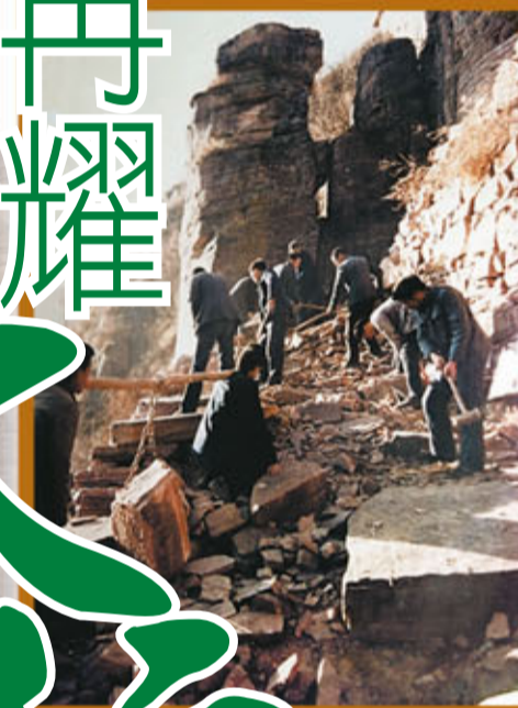
當年築路隊艱苦創業場景。