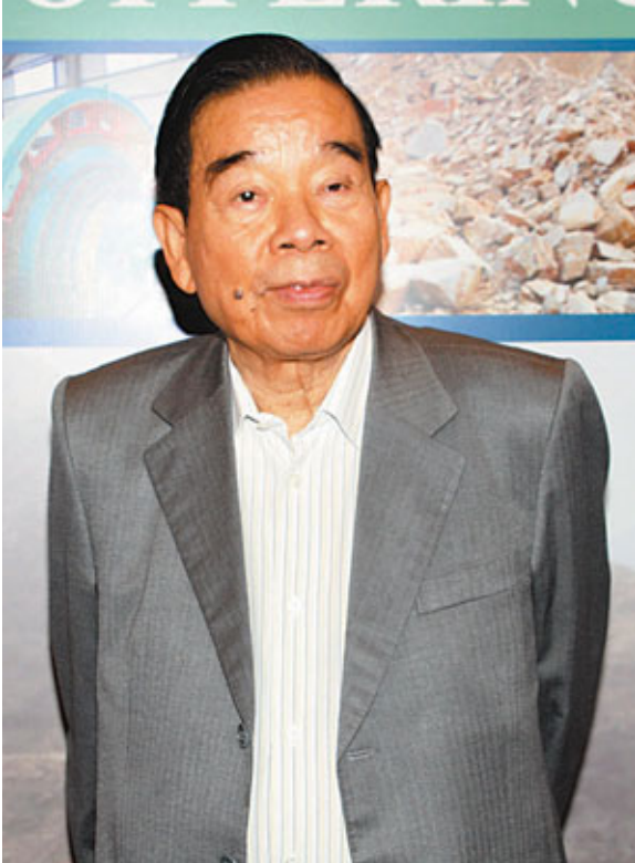
■新世界發展主席鄭裕彤。

綜觀新世界系的財務狀況，實難明其是次集資的原因。首先是現金豐厚，新世界發展擁有達239.71億元現金，新世界中國亦擁106.4億元。其次來年可憑賣樓套現200億元，新世界發展董事總經理鄭家純於公布全年業績時指出，來年在港推出6個項目，約1,900個