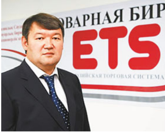
■哈薩克斯坦ETS主席Kurmet Orazayev接受本報獨家專訪。

香港文匯報訊（記者 張易）港交所（0388）前晚與哈薩克斯坦商品交易所（ETS）就相互合作及訊息互換簽訂備忘錄，ETS董事會主席Kurmet Orazayev昨在接受本報獨家專訪時表示，此次跨國合作對港哈兩地具有重要意義。哈薩克斯坦是全球發展最快的經濟體之一，而香港更是亞洲乃至世界聞名的金融中心，ETS將盡最大努力確保彼此都能從合作中獲益。