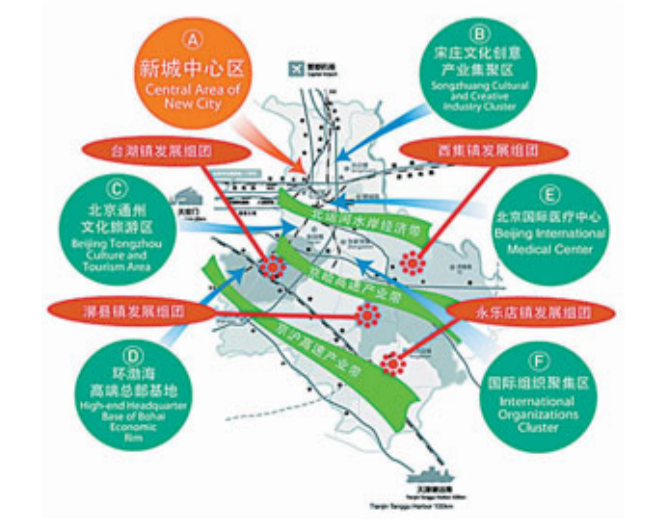
■北京通州新城「一核五區三帶四組團」空間佈局圖