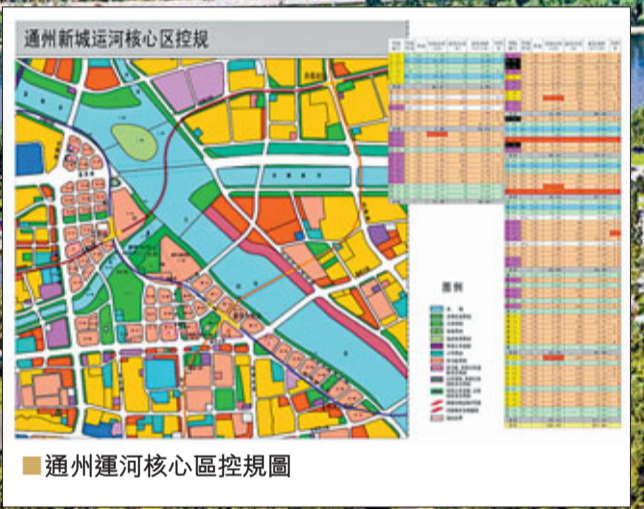
■通州運河核心区區控規劃