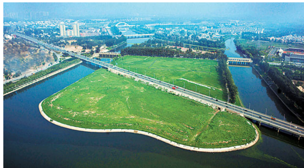
■運河源頭鳥五河交匯處現狀

在「十二五」期間，按照北京市城市空間優化調整以及現代化國際新城建設時序安排，今年通州新城提出了構建通州新城「一核、五區、三帶、四組團」的區域空間格局，站在更高的起點建設北京現代化國際新城。「一核」即全力打造新城中心區，將其作為北京現代化國際新城建設和發展的戰略引擎。「五區」即文化旅遊區，重點建設中國傳統文化與現代時尚元素相融合的時尚旅遊目的地。宋莊文化創意產業集聚區，重點打造為國家級文化創意產業示範區、國際原創藝術的創作區、展示區、交易區。北京國際醫療服務區，將成為北京市大力發展以人為本、新興高端服務產業的重要載體和高端醫療服務的重要基地。環渤海高端總部基地，作為北京參與環渤海區域合作發展的「橋頭堡」和戰略性節點，未來建設成為服務於國家第三增長極的高端商務區。北京國際醫療服務區，將以國際化、科技化、生態化為導向，初步擬定發展空間為「三帶五團」。國際組織聚集區，將重點吸引知名國際組織和機構入駐，承接國際會展與活動，打造國際文化交流與合作平台。