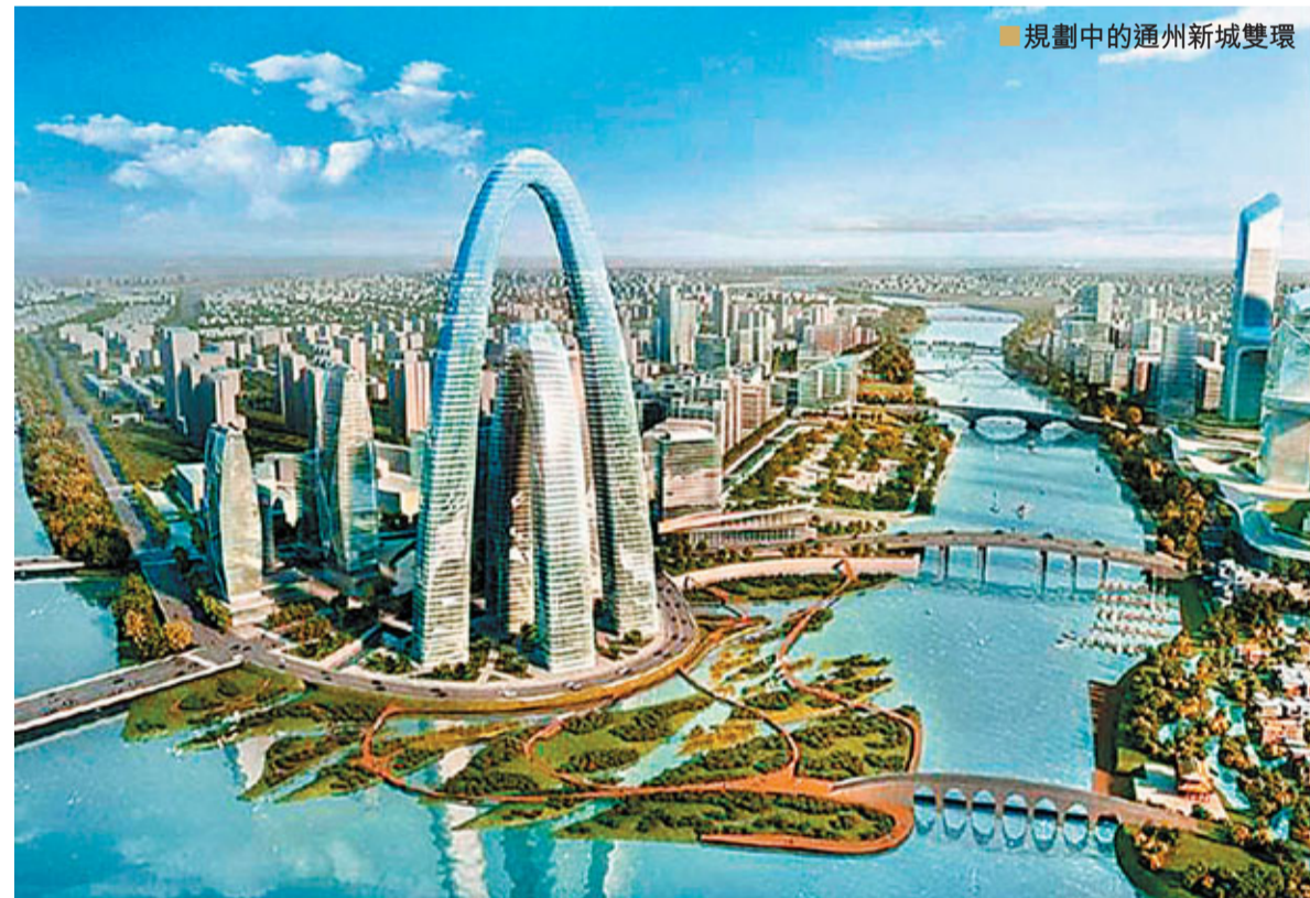
■規劃中的通州新城發展

統籌協調，北京市正式成立通州新城領導小組。北京現代化國際新城全面提速，通州新城「一核五區」的開發建設不斷加快步伐。依托運河豐富的水系，深厚的文化和區位優勢，通州新城着力打造以高端商務為主體、以創意發展為動力、以總部形態為特徵的新城中心區。通州區計劃5年基本建成新城核心区，10年基本建成新城中心區，打造成北京建設中國特色世界城市的先行區、實驗區和示範區。新城中心區作為北京現代化國際新城建設的重頭戲，規劃面積48平方公里，包含運河核心区、協同發展區、生活配套區和發展備用區四大功能區。尤其是今年重點打造的運河核心区16平方公里，位於運河源頭的五河交匯處，是當前高起點建設現代化國際新城的重點區域，未來將建成白天因商務而繁榮，夜晚因休閒娛樂而繁華的不夜水城。