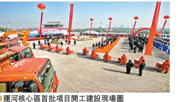
■運河核心区首批項目開工建設現場圖

劃上新增「國際組織聚集區」，聚集區初步選址於通州新城東南部地區，規劃用地面積5平方公里，重點吸引知名國際組織和機構入駐，承接國際會展與活動，打造國際文化交流與合作平台。目前，國際組織聚集區正通過加快推進新城國際交流與合作，着力吸引知名國際組織和機構入駐，積極承接國際會展與活動，加強社會領域的交流與合作，提高新城國際交往能力。通州建設過程中充分利用國際化發展戰略，充分利用國際智力資本、金融資本和產業資本推動新城建設和發展。在城市建設中廣泛應用全球先進技術和理念，有效融合國際元素和本土文化，在城市管理中借鑒全球先進治理經驗，提供世界一流政府服務。瞄準世界500強企業和全球資源要素市場，實施「引進來」提升本土企業品牌創建能力和在全國範圍內的分工協作能力，實施「走出去」。通過提升自身國際形象，增強首都國際功能。