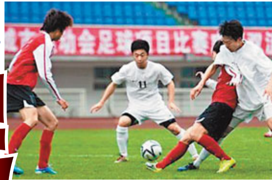
■城運會男足比賽觀眾寥寥無幾。

香港文匯報訊（記者 陳曉莉）第七屆城市運動會16日晚在江西南昌隆重開幕。雖然國家體育總局以及組委會鐵腕嚴整不良賽風賽紀，但仍有害群之馬以身試法，繼日前公佈在運動員年齡資格審查中，已有5個項目共58名運動員被取消參賽資格後，男足賽場也爆出「默契波」的傳聞。