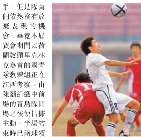
■男足比賽謎八強。

第七屆城運會男足U18小組賽17日結束全部爭奪，擁有9名國青隊員的青島隊成為8支晉級隊伍中唯一的三戰全勝的隊伍。北京東城隊成為唯一三戰皆敗而出局的隊伍。青島隊當日對陣成都隊，儘管已有6分在