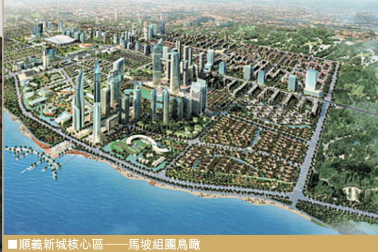
■順義新城核心區——馬坡組團鳥瞰

王剛區長接着說：「近年來，順義與港臺三地一直保持着良好的經貿合作關係，截至目前，全區共有港臺資企業270餘家。新世界集團、北京航空食品、寶德陽、康捷空、香港大洋公司、順豐速運等一大批企業先後入區發展，並取得了驕人業績。港臺企業在實現自身發展的同時，也為順義經濟社會的發展作出了積極貢獻。今年是『十二五』開局之年，我國確立了『國際樞紐空港、高端產業新城、和諧宜居家園』的發展定位，將着力『打造臨空經濟區、建設世界空港口』，努力成為北京東北部中心城市，推動區域經濟社會在新的起點上實現新的跨越。港臺企業在金融、商務、物流、法律、國際航運、國際貿易等服務行業以及電子、光電、信息等高科技產業方面具有豐富的資源優勢，符合順義臨空經濟發展特徵，具有較強的互補性，交流與合作潛力巨大，前景廣闊。我們熱忱地歡迎港臺的各位企業家，今後更多地到順義參觀考察、休閒居住，與我們共謀商機，共求發展，共鑄輝煌。」