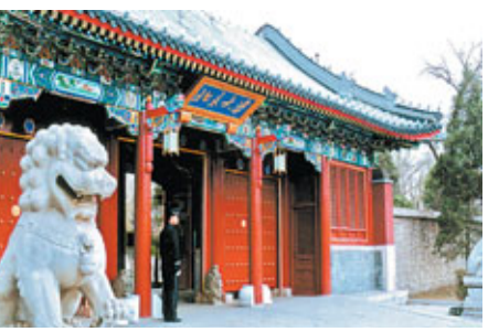
■海定區擁有各類高校68所。圖為北京大學。

創新促進多種資源有效鏈接，盤活存量空間資源提升創新創業承載能力。「三大產業發展帶」：沿中關村大街打造「中關村生命科學與新材料高科技要素聚集發展區」、沿學院路打造「中關村信息網絡世紀大道」、沿知春路打造「中關村航空航天技術國際港」。 海定還將利用中關村科學城科技資源密集度、科技企業聚集度高的突出優勢，促進科技資源與產業的對接，立足北京建設國家科技創新中心的要求，依托中關村「1+6」系列政策，以戰略性新興產業為發展重點，規劃建設一批特色產業園、產業技術研究院等創新創業載體，推動一批重大科技成果转化和產業化項目順利落地，促進科研資源更好、更快的轉化為生產力，與企業和產業對接。 而在海定西北部，目前形成了以香山、圓明園、頤和園等「三山五園」為主體的皇家園林旅遊區和以大覺寺、鳳凰巖等為主體的大西山旅遊區，海定將使這一地區成為集生態、旅遊、休閒等為一體的高端文化休閒功能區。此外，海定南部將用於發展高商務和文化創意，將通過整合區域商場、酒店和文化創意產業資源，形成以「文化、綠色、現代、時尚」為主要元素，以滿足國際文化交流、承接大型國際會議、服務市民生活需要的高端商務服務和文化創意產業區。