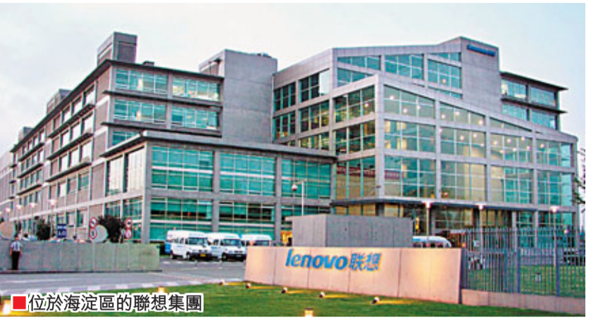
■位於海定區的聯想集團