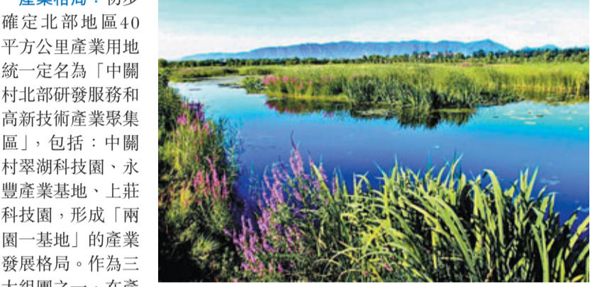
■海定北部濕地風景如畫

中關村翠湖科技園 ：中關村翠湖科技園緊鄰位於海定區北部的翠湖濕地公園。按照規劃，中關村翠湖科技園是海定北部地區規劃的三個主要功能組團之一，是核心區未來十年發展的一塊鑽石級寶地。中關村翠湖科技園的範圍為東臨上莊西路，西鄰六環路，南至京密引水渠，北至翠湖南路，覆蓋了原中關村環保園和中關村創新園兩個區域。該園區規劃佔地面積1873公頃，建築面積1200萬平方米，由北京實創科技園開發建設股份有限公司負責開發建設，並以「智慧翠湖、生態翠湖、人文翠湖」為整體規劃建設理念。