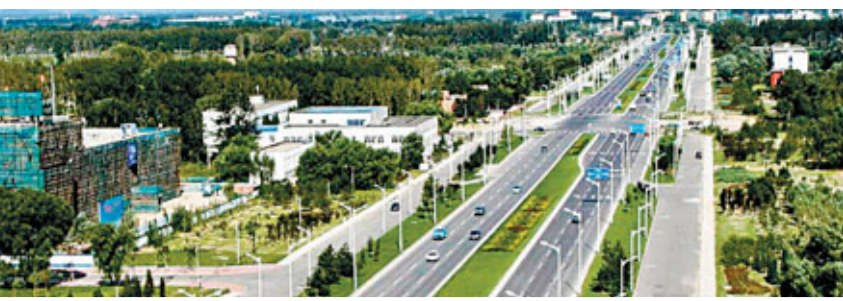
■海定區步入創新發展快速路