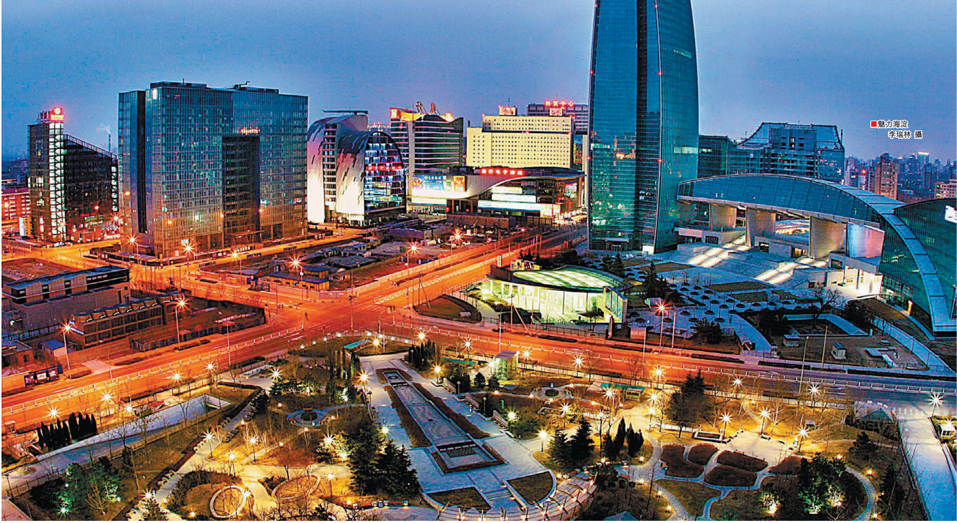
■魅力海定

海定擁有國內乃至全球最密集的高端科技研發創新資源，是國家科技重大專項攻關的「國家隊」和「主力軍」。中關村是中國高新技術產業的發源地，中國第一個國家級高新技術產業開發區、第一個國家自主創新示範區均誕生於此，而中關村正是由海定走出。圍繞國家戰略需求和民生改善，海定區持續開展關鍵核心技術研究和示範應用，不斷產生具有全球影響力的技術、專利和標準，探索出了產學研用有機結合的有效模式。 海定已成為中國戰略性新興產業的技術源頭，佔據中國戰略性新興產業發展的制高點，而港商可順準、選擇相關產業