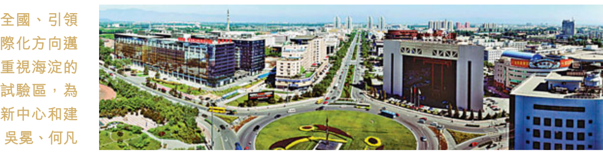
■海定區土地開發發展鳥瞰

在中部研發、技術服務和高端要素聚集區中，海定將在中關村科學城內75平方公里範圍，作為核心區的核心來規劃建設，把資源優勢轉化為創新發展的優勢，推動科學技術加速向現實生產力轉化，使這一地區成為促進戰略性新興產業發展和高端技術研發服務的萬億級產業增長極。同時在中部聚集區的中關村西區形成科技金融、科技中介、產業服務組織、高端創新要素和企業總部、研發機構聚集區。 中關村科學城是中關村核心區的核心，是中國科技資源最密集、科研實力最雄厚、科技研發成果最豐富的地區，將建設成為國家自主創新示範區的「橋頭堡」。這個由中關村大區、知春路和學院路組成的「H」形輻射區域，匯集了以清華大學、北京大學為代表的27所全日制普通高等院校和中科院30餘家研究所、近50家國家級科研機構、25家國家工程技術研究中心、20家國家工程研究中心、62家國家級重點實驗室，同時，還聚集了以大唐電信、微軟為代表的一批大型高科技企業和近8000家中小型高科技企業。 海定將中關村科學城發展思路概括為：一個核心目標、三大重點任務、三大產業發展區。「一個核心目標」：將中關村科學城建設成為具有全球影響力的科技創新中心新地標。「三大重點任務」：以需求拉動