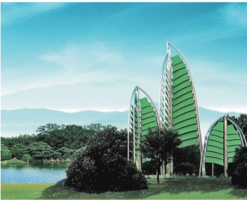
■翠湖科技環境保護

海定是國家首個人才特區——中關村人才特區的主體，將在體制機制上進一步突破，加快聚集、培養高層次人才。中共中央組織部等15個中央單位與北京市委、市政府今年3月聯合印發文件，又於7月召開中關村人才特區建設工作大會，提出加快把中關村示範區建設成為具有全球影響力、體現中國特色的人才戰略高地。 海定作為核心區也出台相關措施，並設立了人才發展專項資金，每年從區財政預算中安排不少於1億元，主要用於支持高層次人才創新創業、獎勵做出突出貢獻的高層次人才和引才單位（個人）、引進和培養高層次人才、為高層次人才提供相關配套服務。 以人為本，海納百川。海定正加快聚集培養高層次人才，實施海外人才吸引聚集工程；加快建立健全高層次人才工作機制，構建高層次人才評價體系，開展核心區高層次人才認定，積極推進股權激勵試點，打造國際化人才市場體系；還加快建設高層次人才服務保障體系，從組織領導、資金保證、配套住房、子女入學、醫療服務、獎勵體系等6個方面制定措施，大力營造良好的人才發展環境。 經過近年來的不懈努力，海定區人才工作走在北京市乃至全國的前列，成為國內外知名的人才聚集區。在一系列人才引進政策的帶動下，已有40餘家跨國公司在海定設立研發中心，大批留學生回到海定區創業，國際性科研組織也紛紛搶灘中關村。截至目前，在美國納斯達克上市的中關村企業有24家，其中半數是近年來海外高端人才創辦的企業。海外高端人才企業的註冊資本總額累計超過50億元，累計吸引了數百億元的境內外資本。海定建設人才高地的戰略已初見成效，並將為更多懷有創業夢想的人才創造圓夢的機會。