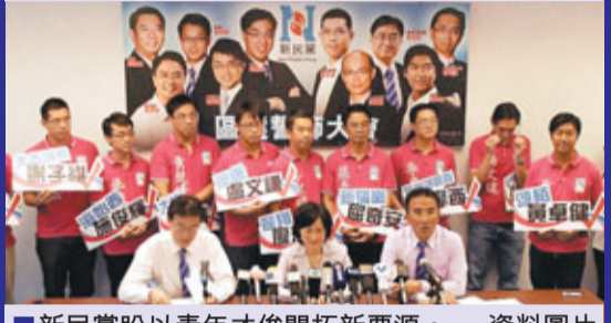
新民黨盼以青年才俊開拓新票源。資料圖片