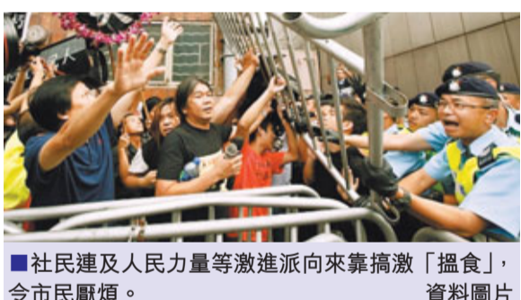
社民連及人民力量等激進派向來靠搞激「搵食」，令市民厭煩。資料圖片

激進派的「狙擊術」對競選對手有多大殺傷力，宋立功坦言，建制派長期扎根地區，選情較反對派穩陣，並預期「人民力量」等現階段仍然傾向推動具爭議性的全港議題，但不排除他們會在最後階段「出茅招」，「你日日在地區搞激，街坊都會厭倦，但直到區選投票前10日，或許有人會靠衝擊等招數，在短時間博取選民的支持」。