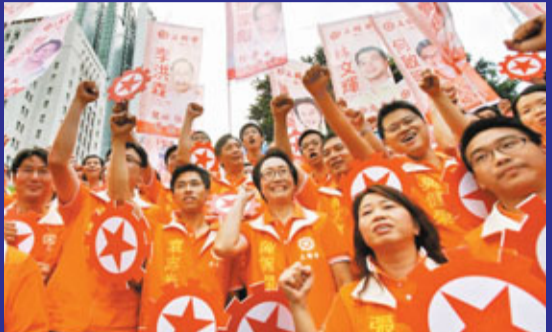
工聯會一貫務實作風為基層爭權益。資料圖片

新一屆區議會選舉11月6日舉行，為爭明年立法會「超級區議員」議席入場券，加上反對派自相殘殺，令這場政改一役後的首場地區選戰烽煙四起。全港18區選舉主任共接獲935份提名表格，參選人數創新高，而撇除76個自動當選者後，即839人角逐共336個議席。各黨派團體為搶佔灘頭地，都扭盡六壬，民建聯、工聯會等主攻地區往績及民生議題；激進黨則空降參選，沒有政績，只談狙擊；新進黨派或地區力量如新民黨、新民主同盟及民協等亦傾力一戰，希望增加政壇參與度和議價力。